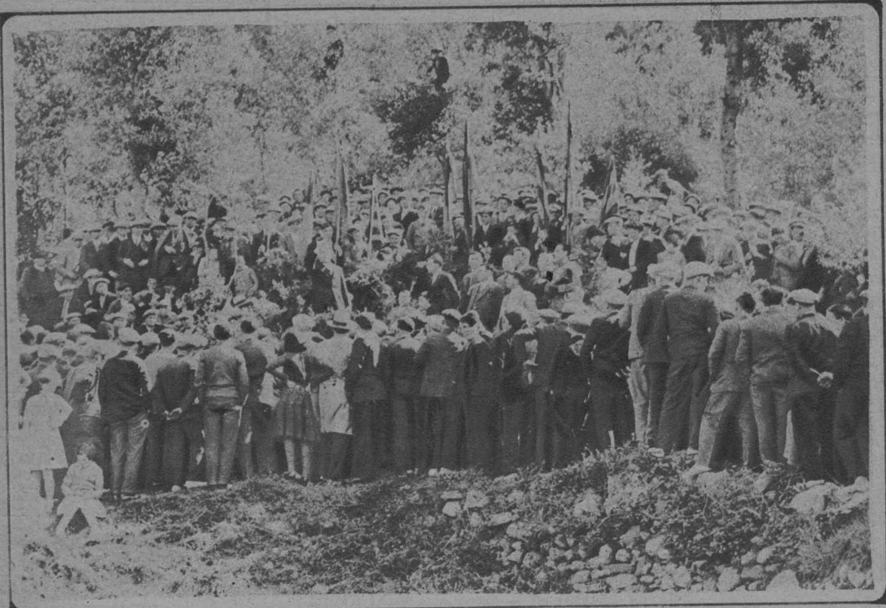
El público, durante el acto.