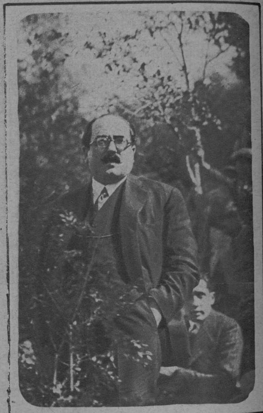
El gobernador de Gerona, don Claudio Ametlla, en un momento de su discurso.