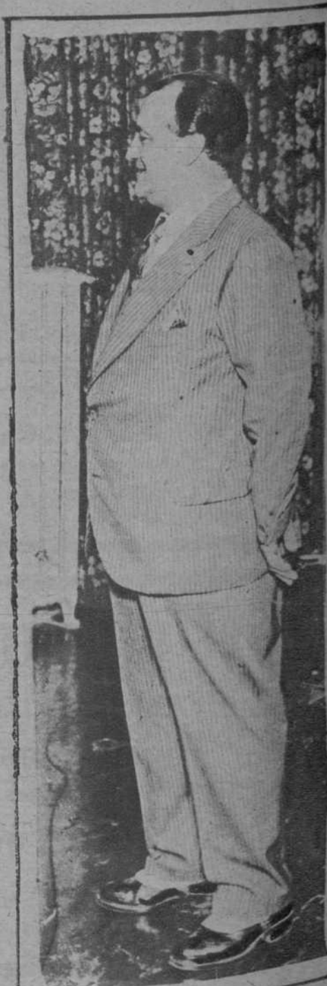
El gran tenor Hipólito Lázaro, anunciando por el micrófono de "Radio Barcelona", la función a beneficio de los Hospitales, celebrada en Novedades.