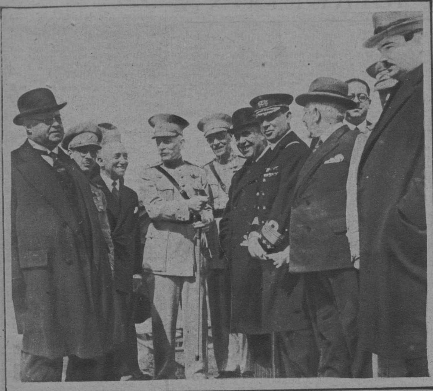
Oporto.—El embajador de España en Lisboa, señor Rocha, a su llegada a esta capital, es saludado por el Presidente de la República, general Carmona, y miembros del Gobierno