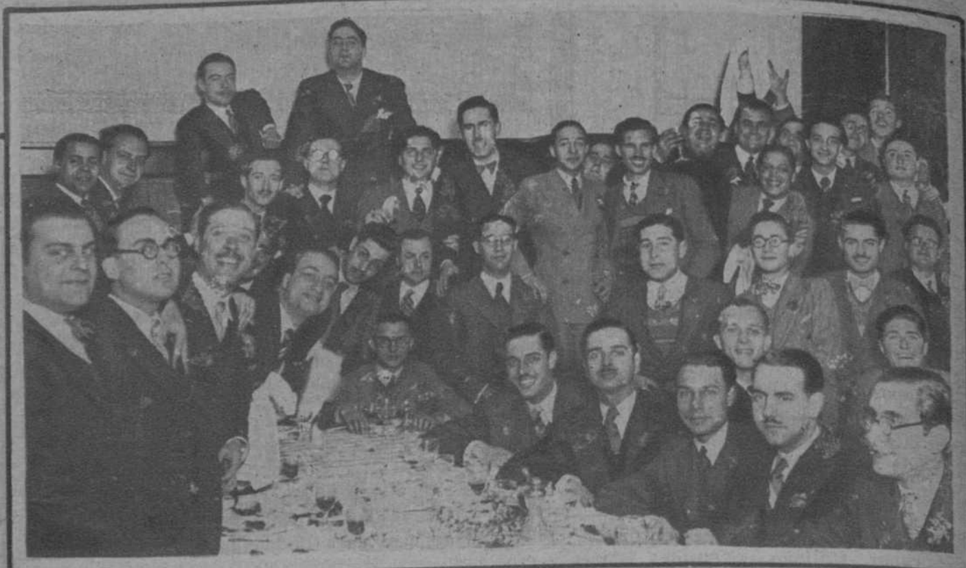
Los médicos de guardia y alumnos del Hospital Clínico, reunidos en el banquete que celebran anualmente.