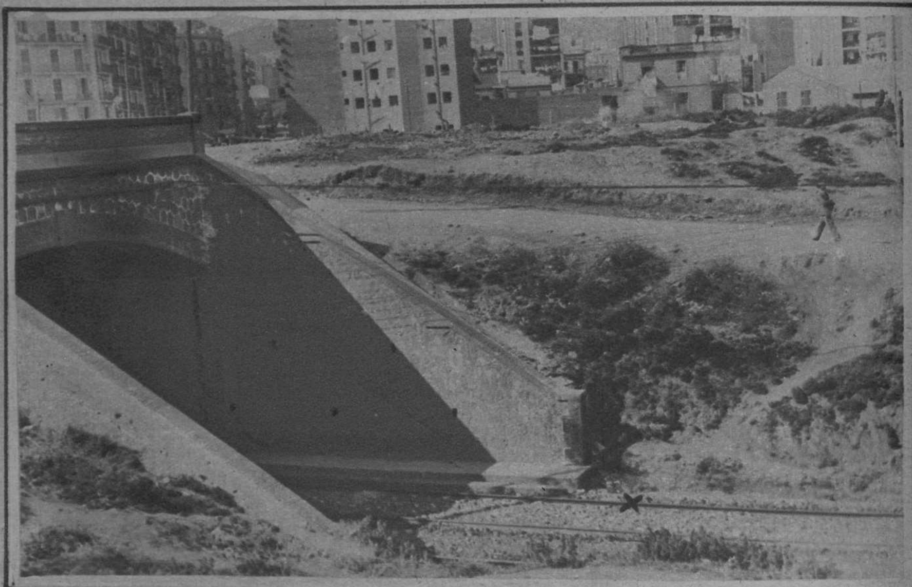
Lugar (x) donde fué encontrado el cadáver de Nemesio Gárate