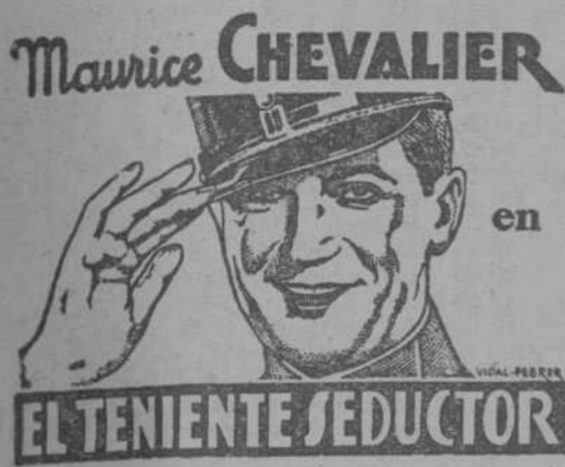
Maurice CHEVALIER en EL TENIENTE SEDUCTOR

Los «sets» que vieron los visitantes nipones otsequiados por la estrella reproducían conocidos lugares de Venecia y de Budapest, y pertenecían a la nueva película de aquella, «Esta noche o nunca».