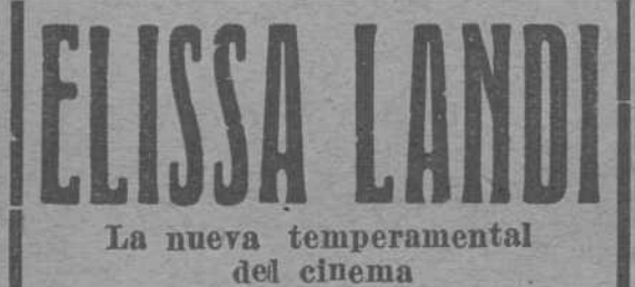
La nueva temperamental del cinema

Una dulce, pero breve felicidad, después de una vida de miseria y trabajo—amor sin riquezas, y luego riquezas sin amor, y un final tan delicado como el más bello ensueño—, tal es el resumen de la romántica historia que representa la "pareja ideal", Janet Gaynor y Charles Farrell, en su más reciente producción titulada "Marianita" y