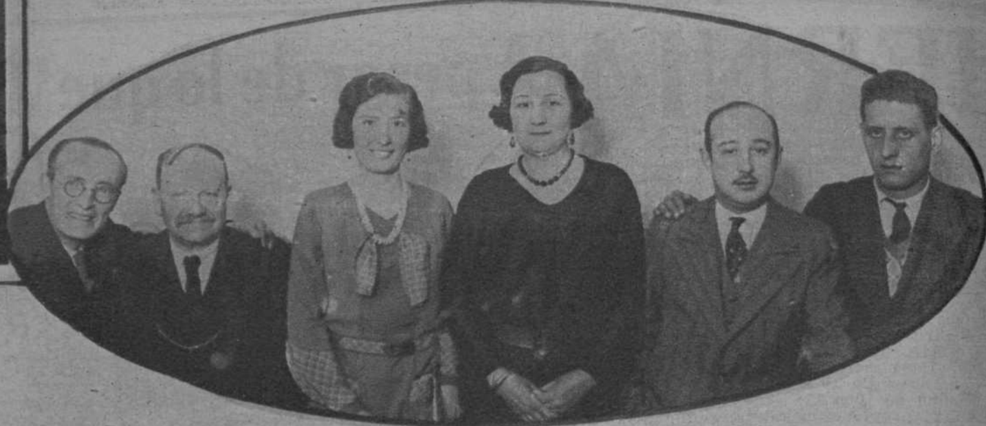
Presidencia del acto inaugural de la «Sección Femenina Sportiva» del «Círculo Recreativo de Sordomudos».