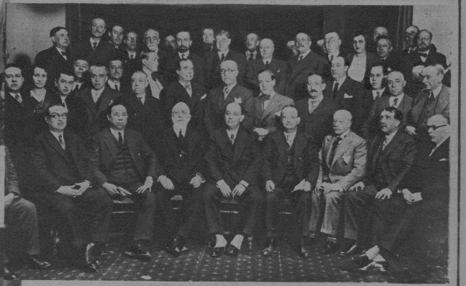
Madrid.—Concurrentes a la Asamblea de Presidentes de las Cámaras de la Propiedad Urbana de toda España, celebrada en la de esta capital.

ALFARA (TARRAGONA).—PARA EL FOMENTO DE LA INDUSTRIA SERICOLA Y LA DERIVADA DEL PALMITO. PLANTACION DE MORERAS, EN LA «FIESTA DEL ARBOL», PATROCINADA POR EL AYUNTAMIENTO Y POR LA «SECCION SERICOLA DE HUERTAS DE JESUS Y MARIA». Grupo de autoridades, maestros y niños de las escuelas, que asistieron y participaron en la «Fiesta del Arbol»