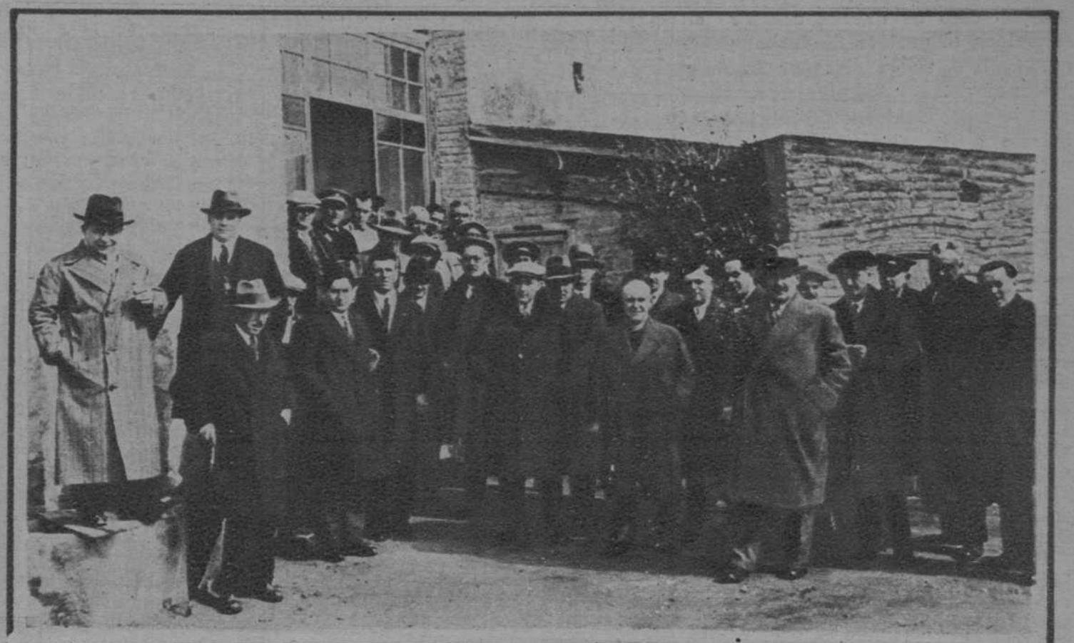
Igualada.—La Junta y Patronato de Beneficencia Igualadina, en el acto inaugural de sus nuevos locales.