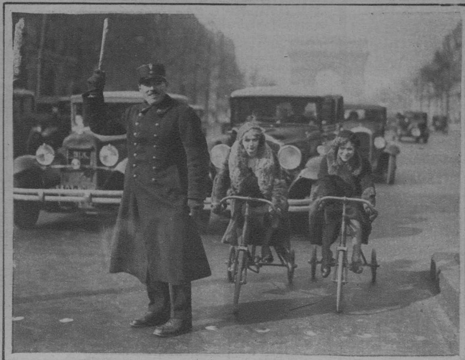
Una moda que vuelve, en París, por lo menos: el triciclo, como vehículo predilecto de la mujer ciclista.