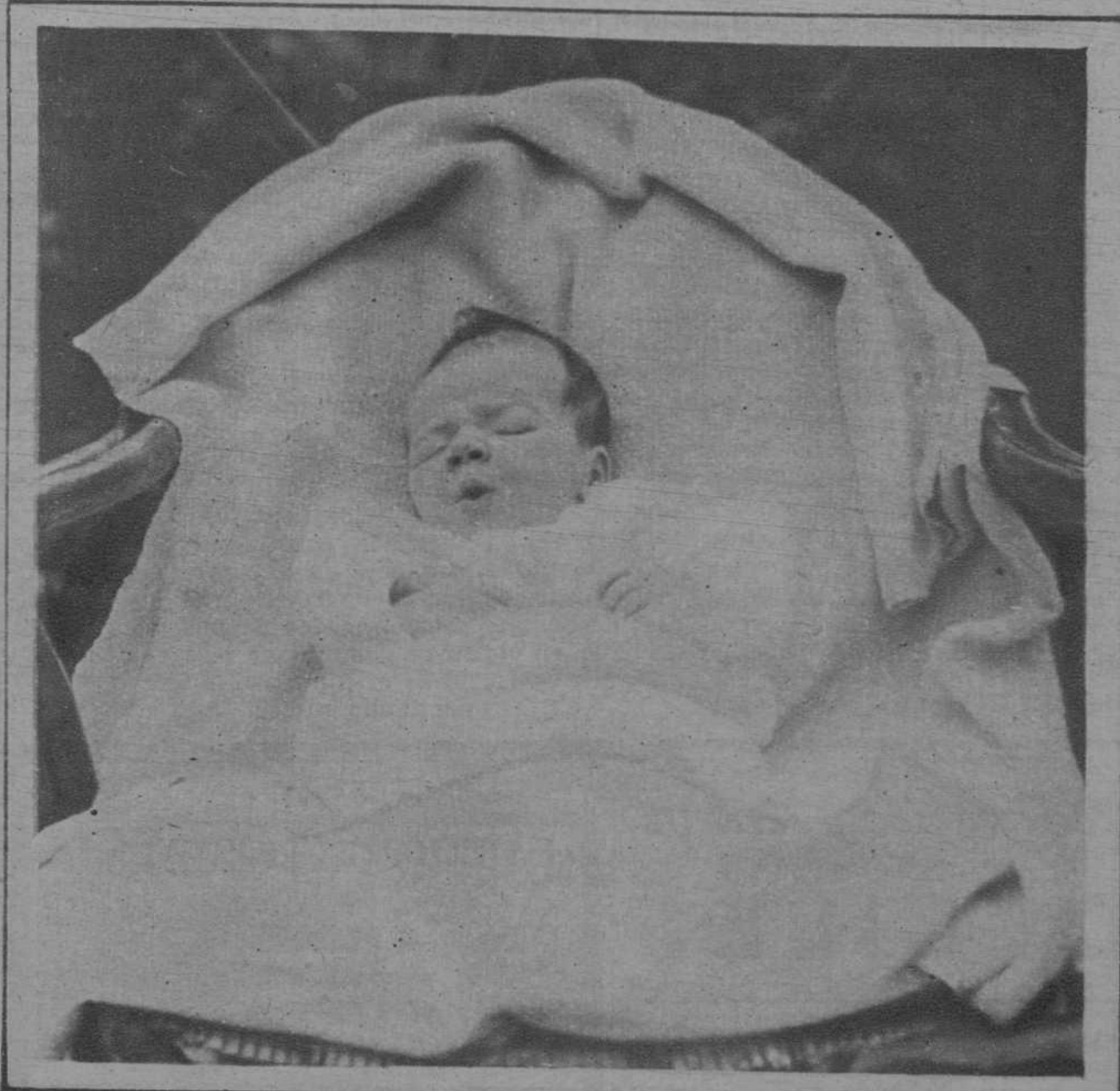
He aquí al hijito del glorioso aviador Lindbergh, que ha sido secuestrado en Hopewell (Nueva Jersey). Los bandidos que han perpetrado el hecho, señalan la cifra de cincuenta mil dólares, como rescate de la criaturita.