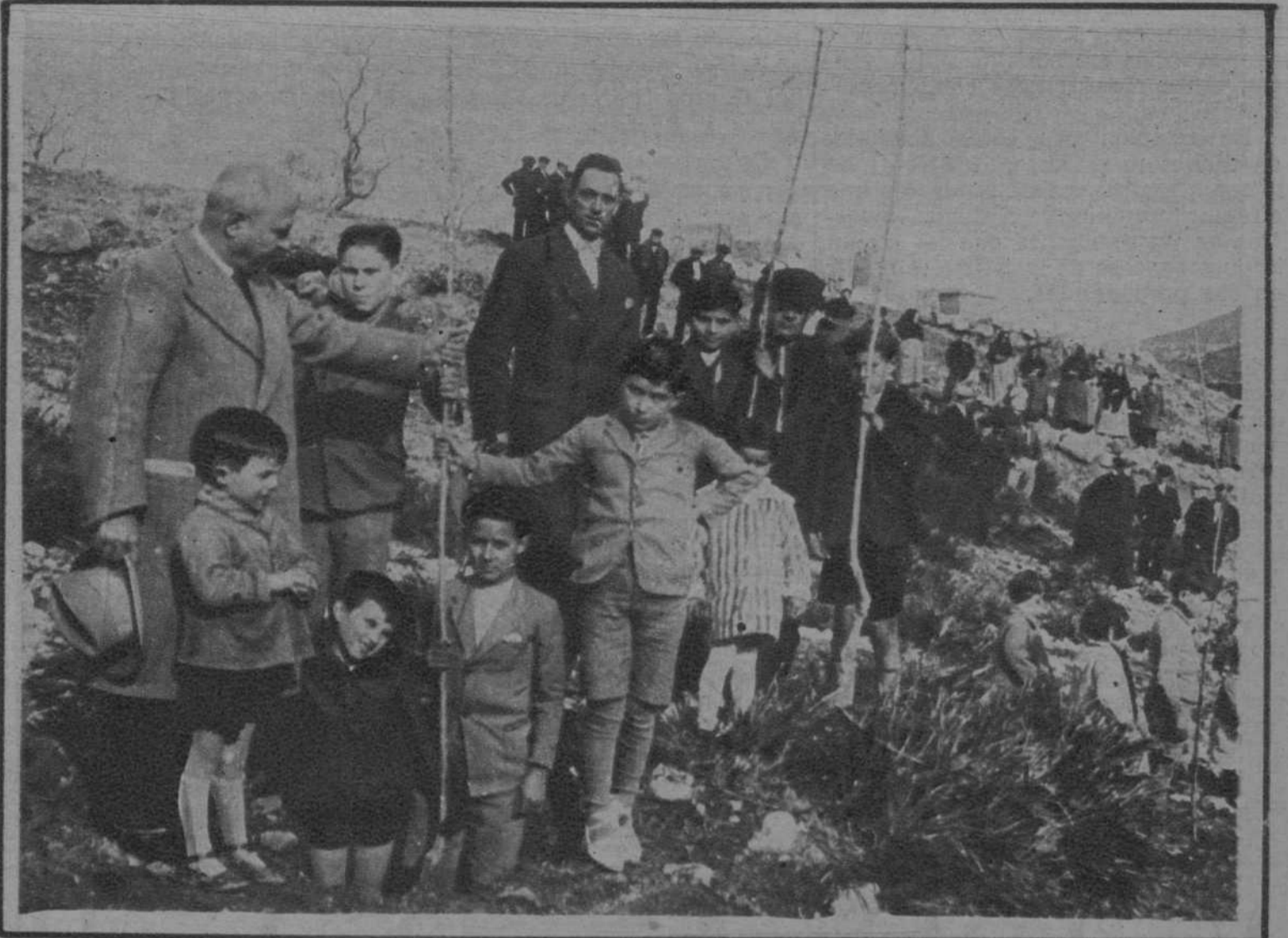
Plantando una morera

ALFARA (TARRAGONA).—PARA EL FOMENTO DE LA INDUSTRIA SERICOLA Y LA DERIVADA DEL PALMITO. PLANTACION DE MORERAS, EN LA «FIESTA DEL ARBOL», PATROCINADA POR EL AYUNTAMIENTO Y POR LA «SECCION SERICOLA DE HUERTAS DE JESUS Y MARIA». Grupo de autoridades, maestros y niños de las escuelas, que asistieron y participaron en la «Fiesta del Arbol»