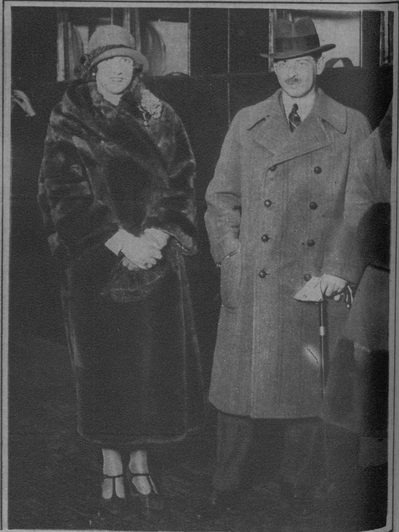
El veleidoso rey Carol, de Rumanía, con su esposa, la reina Elena, con la cual parece que se ha reconciliado.