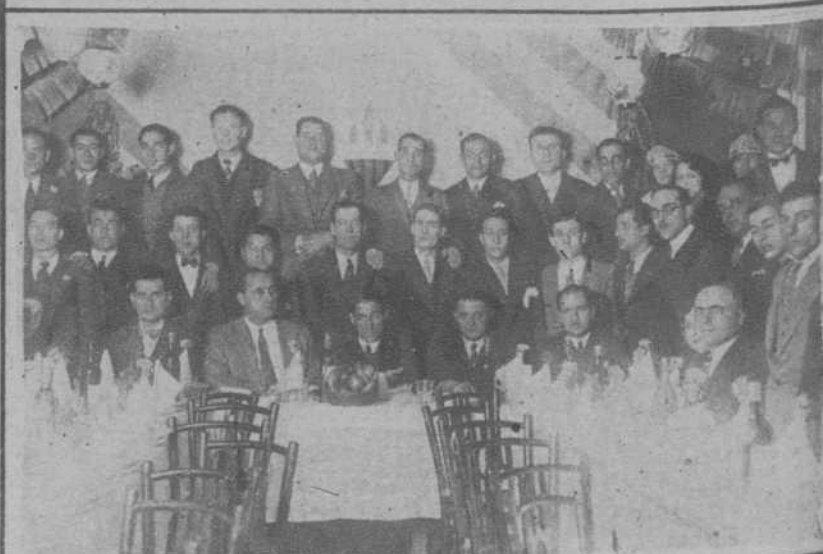
Banquete ofrecido a los jugadores de la «U. S. de Sans».