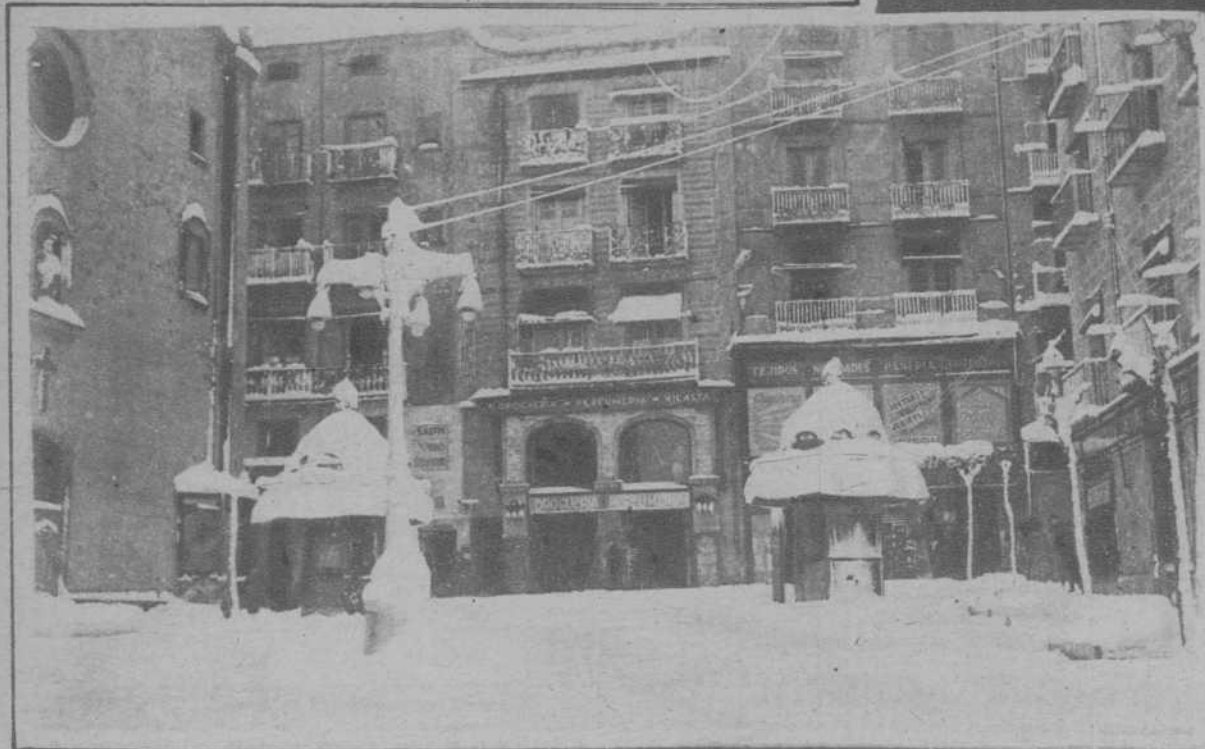
Lérida.—La Plaza de la Libertad, después de la copiosa nevada que cayó sobre nuestra ciudad.