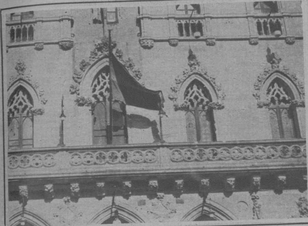
Tarrasa.—La fachada del edificio del Ayuntamiento—donde ondea ya la bandera de la República—, en el que pueden apreciarse los impactos de los proyectiles