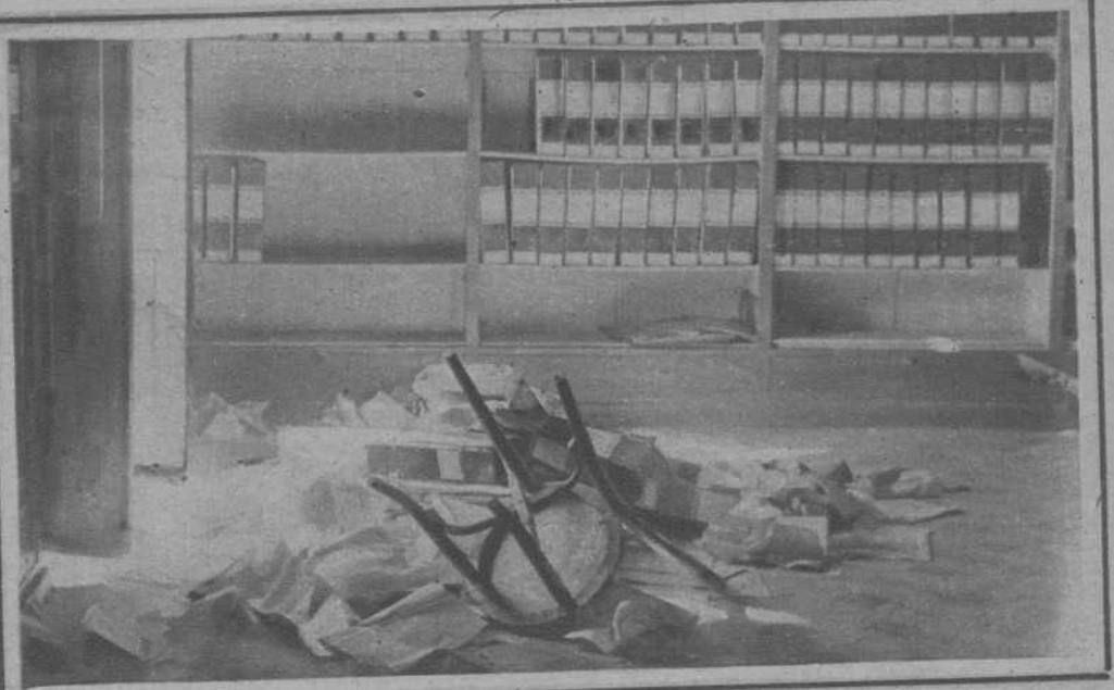
Tarrasa.—Un aspecto del archivo municipal, en el que se parapetaron los revoltosos