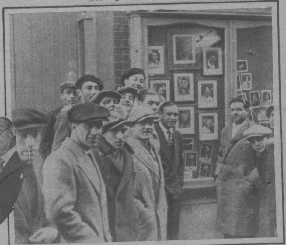
Tarrasa.—Grupo de curiosos, contemplando los cristales del escaparate de una fotografía, destrozados por los disparos de los revoltosos.