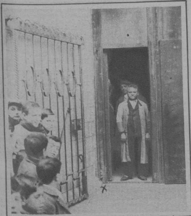
Lugar (X) de la puerta de la iglesia del Carmen, donde fué colocado un artefacto que hizo explosión sin, por fortuna, ocasionar desgracias.