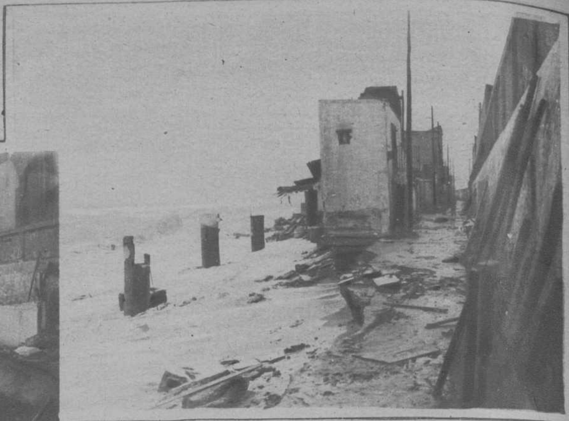
Dos aspectos de los destrozos causados por los últimos temporales, en las modestas viviendas de la barriada de Pekin.