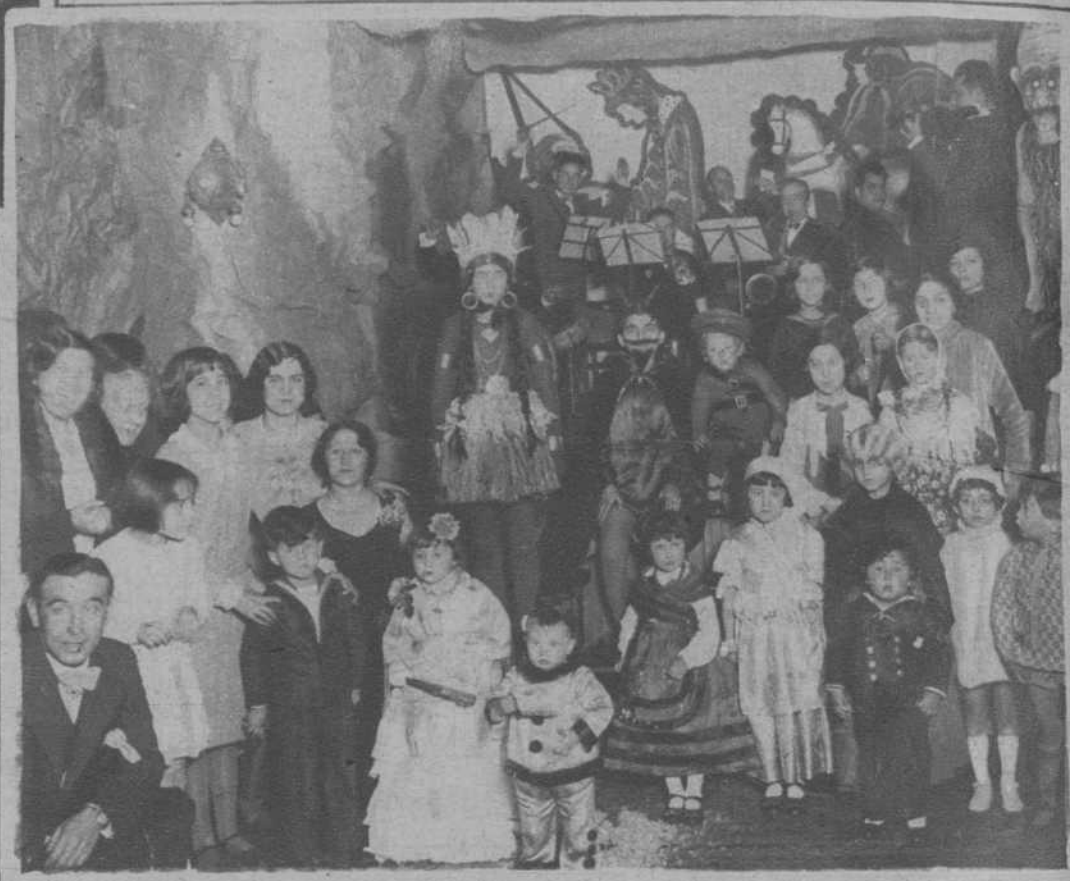
Grupo de niños disfranzados que concurrieron al baile infantil de Piñata, organizado por el Casino de Clases del Ejército y la Armada.