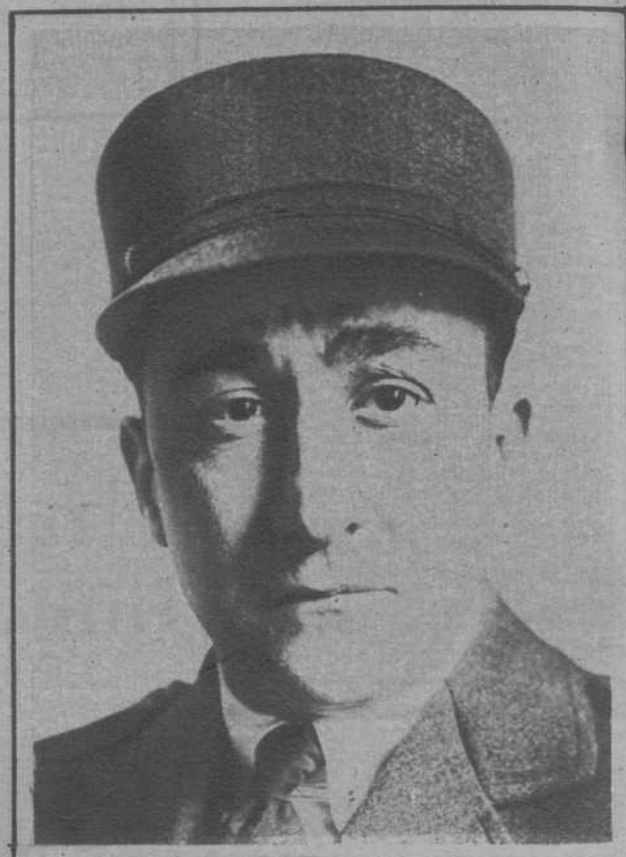
El aviador americano Bert Mall, que, con el nombre de Cheng-U-Chang, manda las fuerzas aéreas de China. Bert Mall, hoy general del ejército chino, fué un gran piloto durante la gran guerra, a lo largo de la cual derribó varios aviones enemigos.