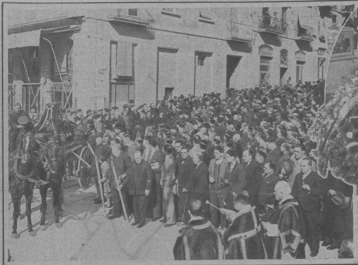
Momento de ponerse en marcha la fúnebre comitiva, formada por Tarragona en masa