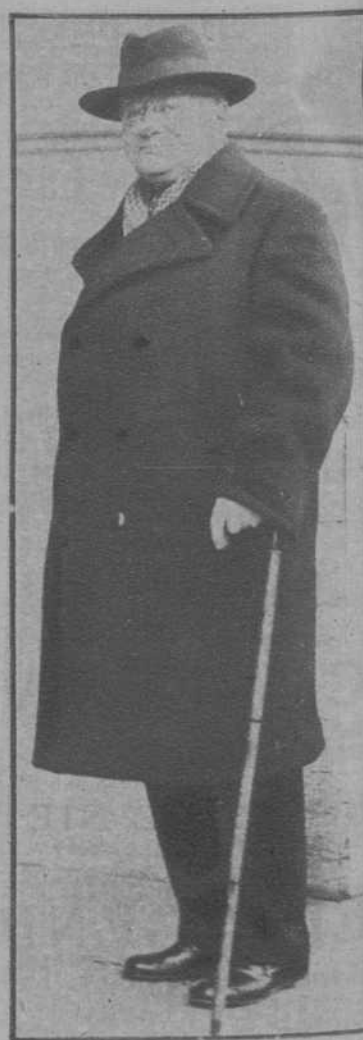
Ginebra. - El Comisario de Negocios Extranjeros de Rusia, señor Litvinoff, llegando a una de las sesiones de la Conferencia del Desarme.