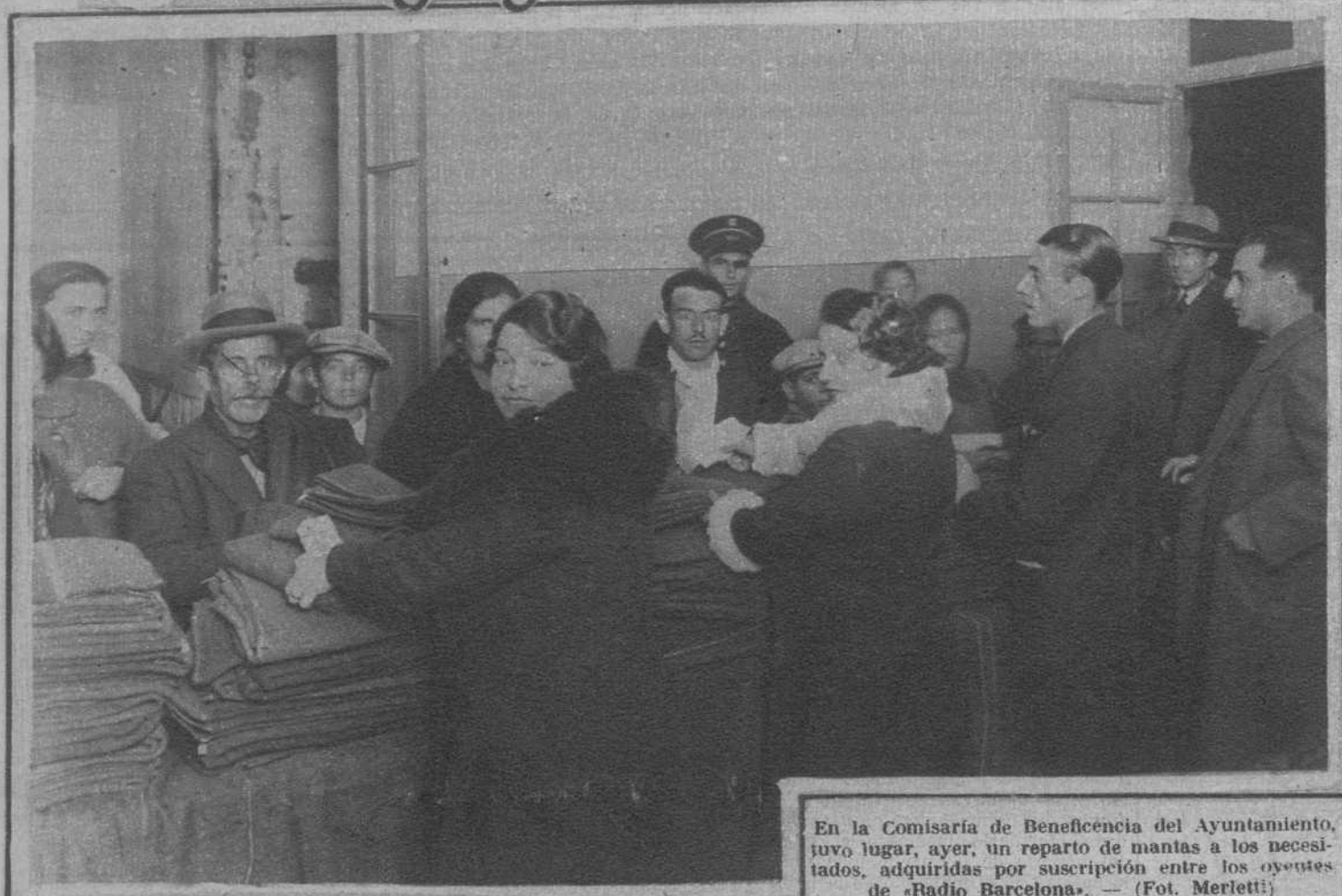
En la Comisaría de Beneficencia del Ayuntamiento, tuvo lugar, ayer, un reparto de mantas a los necesitados, adquiridas por suscripción entre los oyentes de «Radio Barcelona».