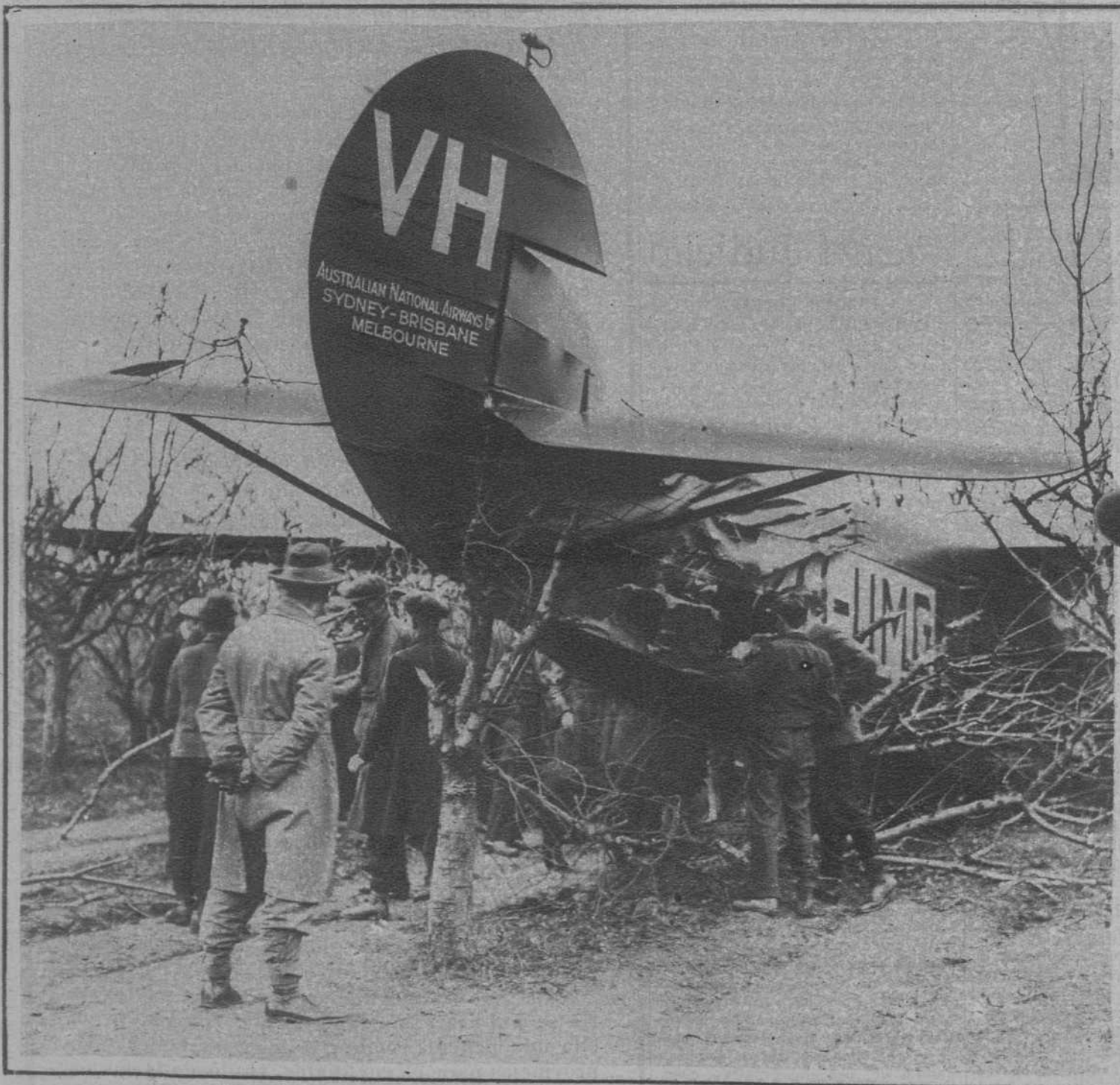
Londres.—Estado en que quedó el avión-correo de Australia «Estrella del Sur», después del violento aterrizaje que se vio precisado a realizar.

LA CONFERENCIA DE LOS GOBIERNOS PARA TRATAR DE LAS DEUDAS DE GUERRA