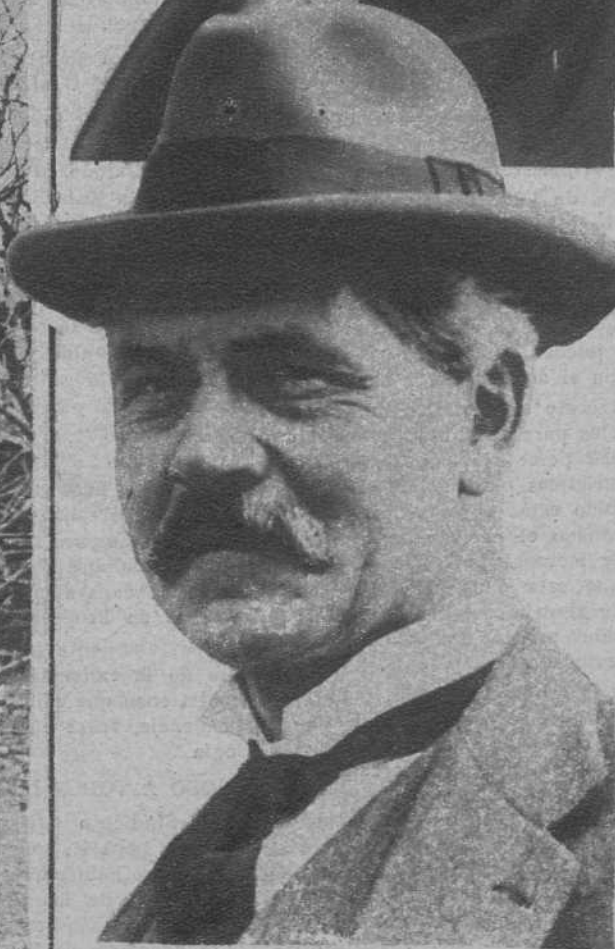
El general Dawes, que asistirá, como observador, en representación de América. El señor Laval, representante de Francia. El señor MacDonald, representante de Inglaterra.