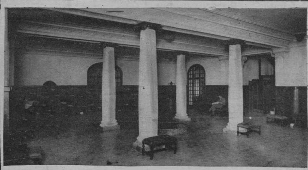
Suntuoso hall y ascensor al fondo, del balneario Termas Orion, de Santa Coloma de Farnes (Gerona), cuyas salutíferas aguas adquieren tan justa fama