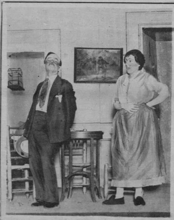
Madrid.—Una escena de la comedia «Como los propios ángeles», estrenada en la Zarzuela.