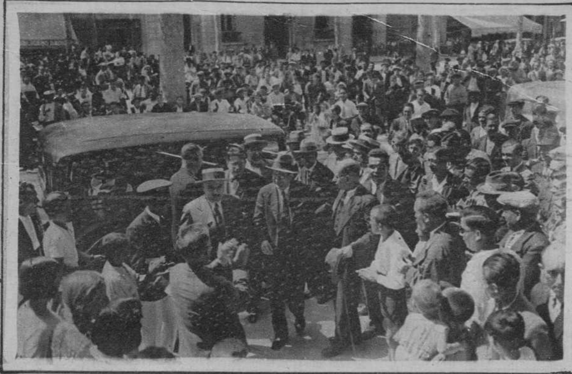
Don Marcelino Domingo, al llegar al teatro donde dió su interesante conferencia.