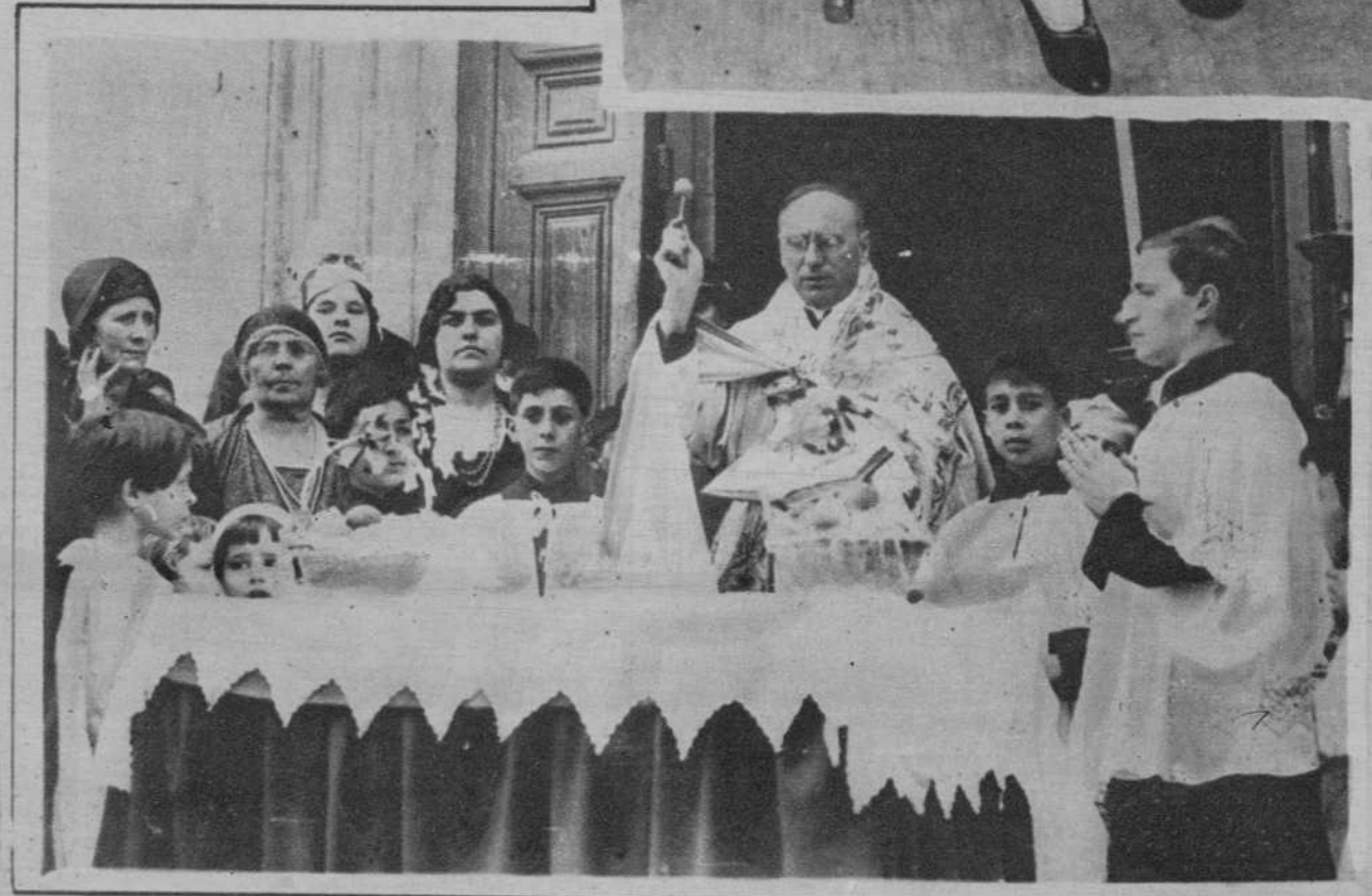
En Gandolfo, junto a Roma, se ha celebrado la curiosa ceremonia anual de bendición de los melocotones.

Frasco . . . . . Ptas. 4,25 Frasco doble. » 7,50 (Móviles y sanitarios, incluidos)