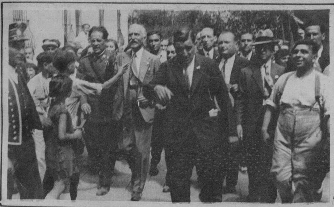
El Presidente de la Generalidad se dirige, a pie, a visitar las Escuelas de Verano