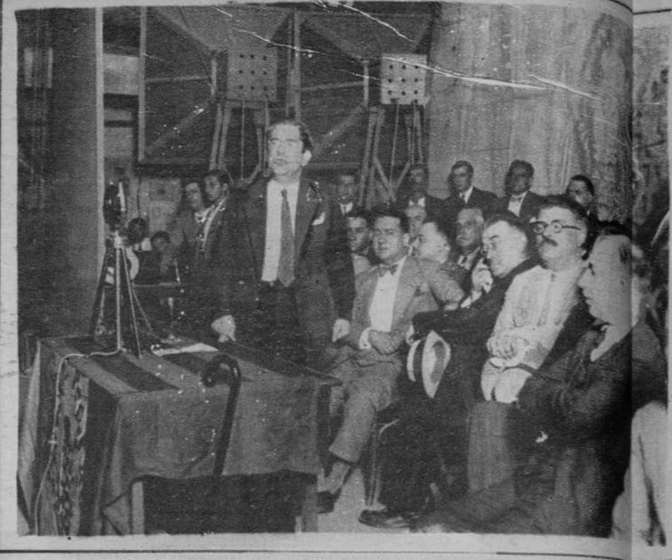
El ministro de Instrucción, en un momento de su discurso.