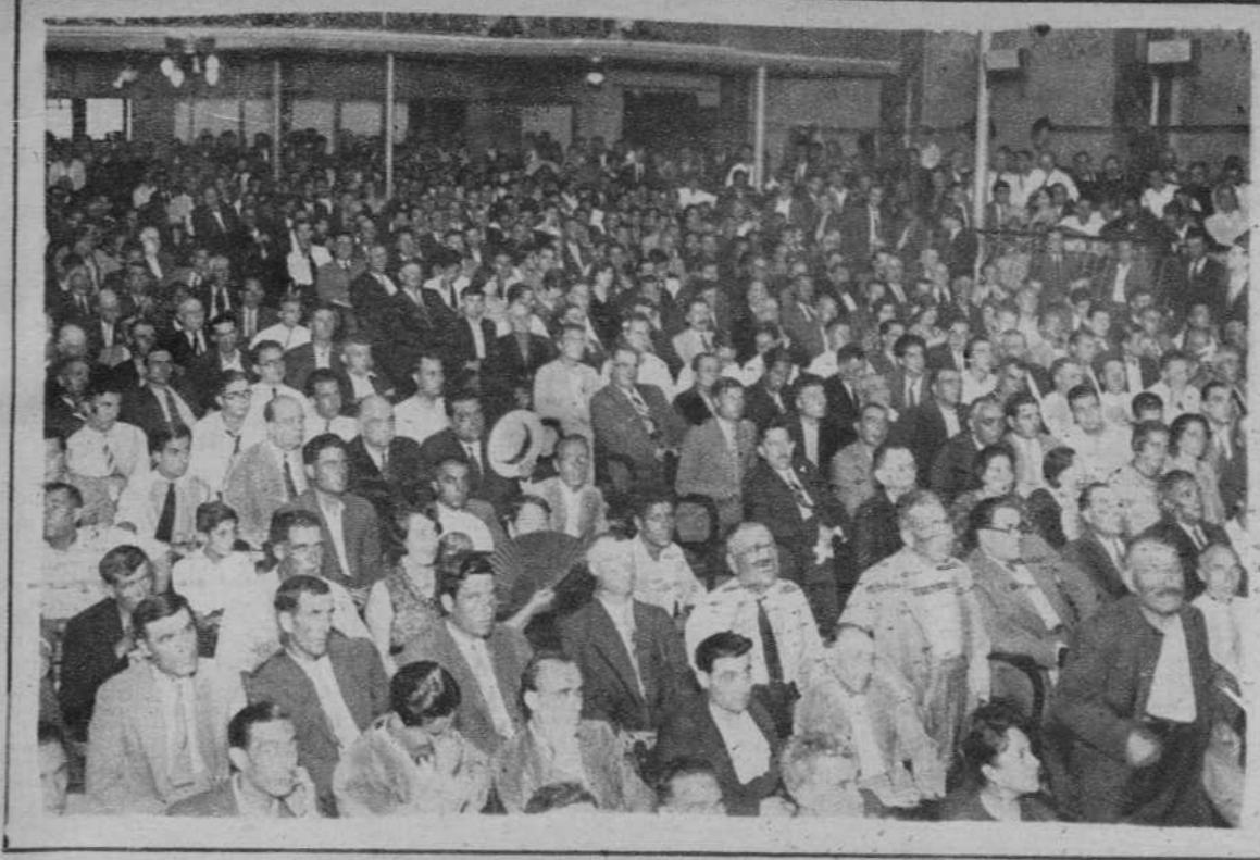
El público, durante el acto.