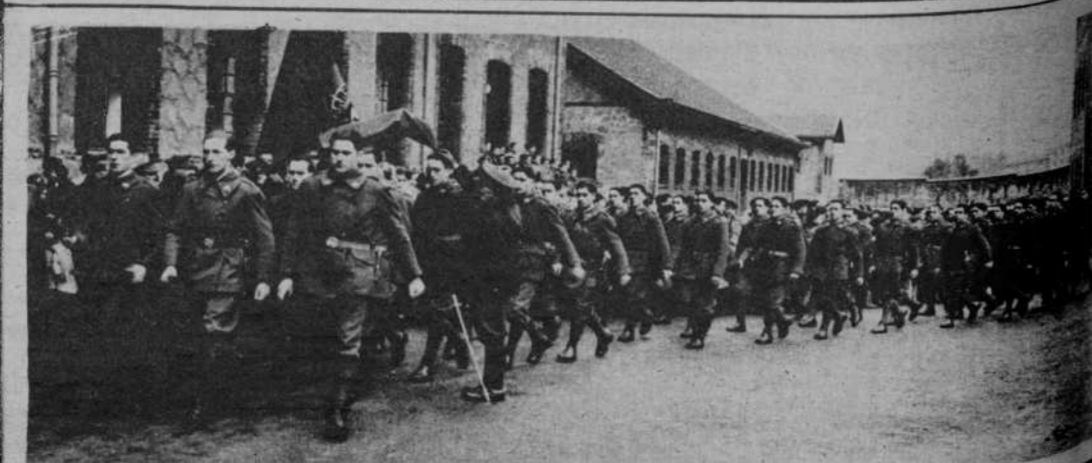
Dos momentos de la Jura de la bandera, que este año, en Bilbao, ha revestido gran solemnidad. En ellos, vemos a las tropas durante la misa de campaña, en el patio del cuartel, y el destile de los reclutas una vez terminada la ceremonia.