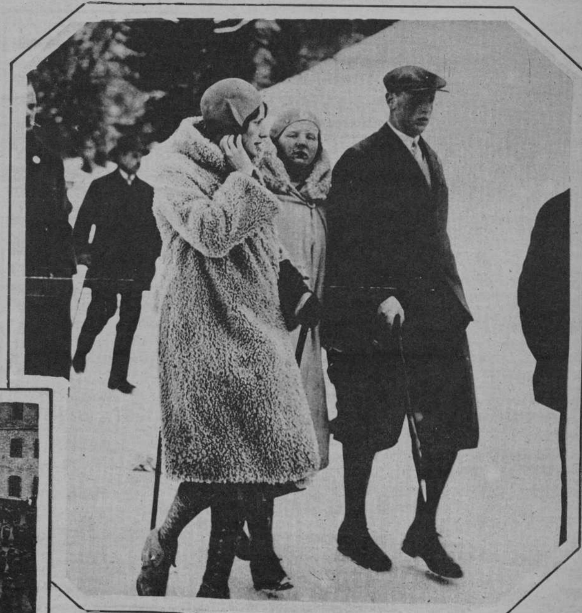
Fotografía tomada en Obersdorf, de la princesa Juliana, heredera del trono, de Holanda en el momento de dirigirse al lugar donde ha de celebrarse el campeonato alemán de patinaje sobre skis, deporte que goza de sus mayores preferencias y que cultiva intensamente.