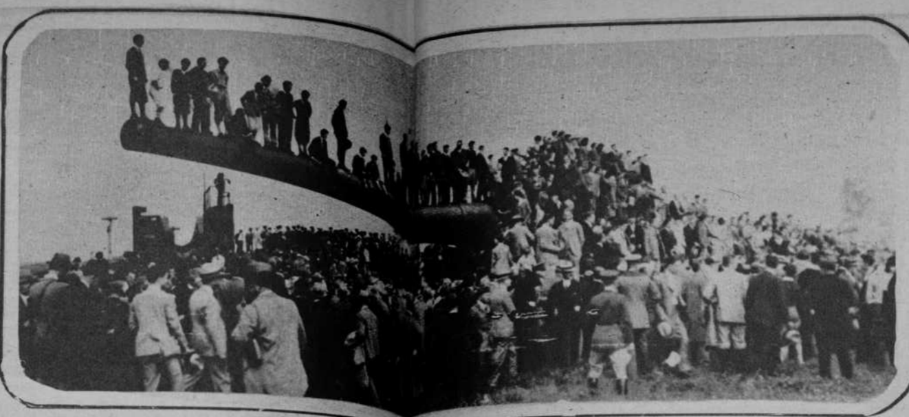
El destino de los viejos cañones de 400 milímetros. El monstruo de acero, que tan importante y trágico papel desempeñó en la pasada guerra, sirve hoy de plataforma, en Aberdeen, para que la multitud pueda contemplar a su sabor una fiesta deportiva.