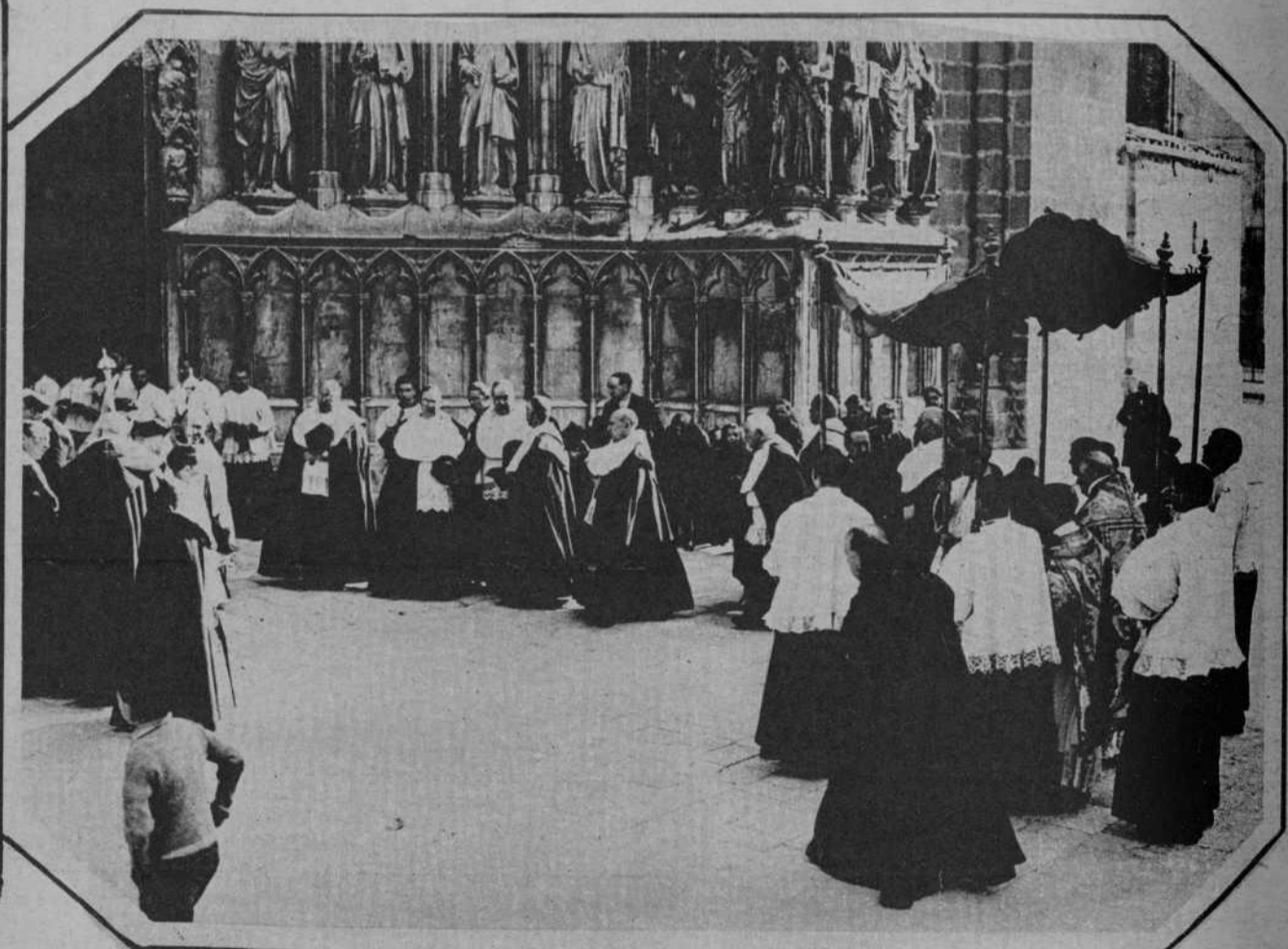
En Tarragona se ha celebrado la procesión de la Bula de la Santa Cruzada. La fotografía nos muestra el religioso cortejo a su llegada a la puerta principal del Templo Metropolitano, donde es recibido por el Cabildo y el clero Catedral.