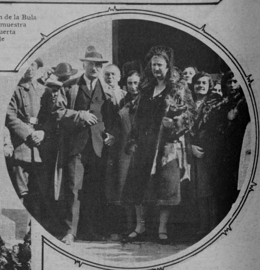
Se ha celebrado, en Sevilla, la tradicional y típica Romería del Rocío. De la Romería de este año, publicamos las dos notas adjuntas. Una de ellas reproduce la entrada del "Simpicado" en la iglesia de Almonte, y la segunda, nos muestra a los infantes en la puerta de dicho templo, esperando a los romeros.