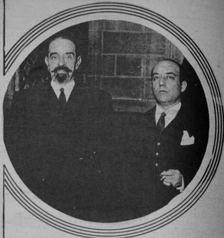
El nuevo gobernador civil de esta provincia, don Ignacio de Despujol, ha visitado a las autoridades locales, al tomar posesión de su cargo. En las presentes fotografías vemos a la primera autoridad de la provincia en el Palacio de la Diputación y en las Casas Consistoriales, donde fué recibido, respectivamente, por el conde del Montseny y el barón de Viver.