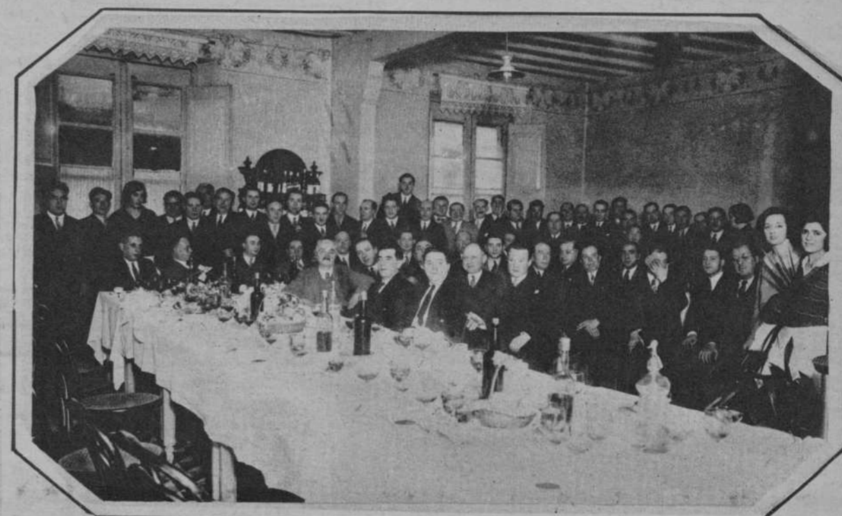
Banquete celebrado en el Hotel del Comercio, de Figueras, con motivo de la Asamblea Provincial de Sastres, de Gerona. Fué un acto cordialísimo, digno remate de una Asamblea en la que dominó el mayor compañerismo y alto espíritu de clase.