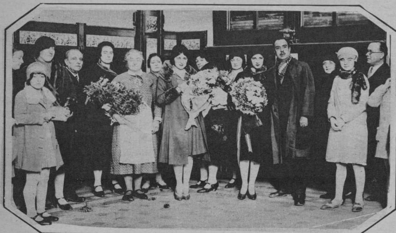
Ha regresado a Valencia la señorita Elena Pla Momó, o sea «Miss España». En la fotografía vemos a la gentil reina de belleza de España para 1930, rodeada de sus familiares, poco después de su llegada.