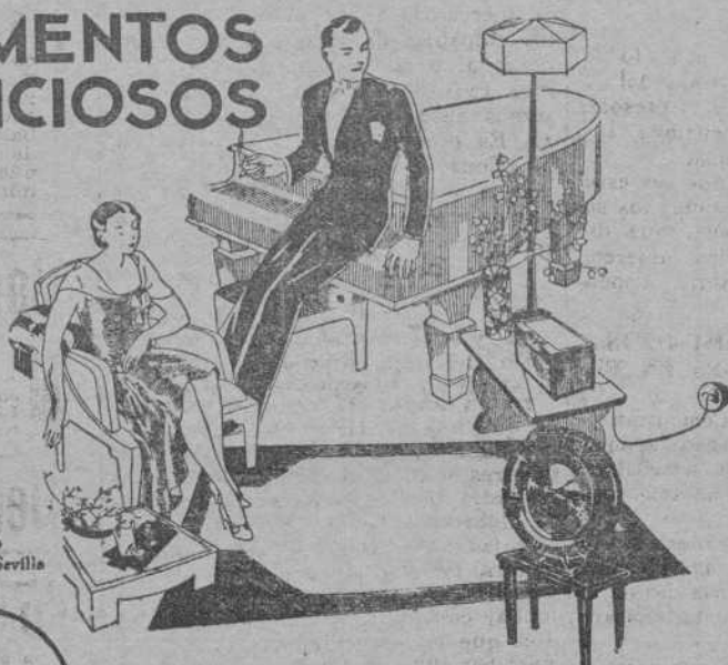
Visite el Stand PHILIPS en la Exposición de Sevilla

La música con toda su brillantez y sonoridad, a través de un aparato que es un mueble que no desentona en el hogar más lujoso. Esto representa el RECEPTOR PHILIPS DE LUJO CON ENCHUFE A LA LUZ Y SU ALTAVOZ ELECTRO-MAGNÉTICO.