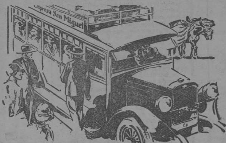
Por su gran resistencia admite fácilmente la sobrecarga cuando sea necesario

Hay dos modelos: el tan conocido camión de una tonelada, para toda clase de trabajos, con dos sistemas independientes de frenos, y la camioneta de media tonelada para el reparo rápido, con frenos a las cuatro ruedas, además de los dos sistemas independientes.