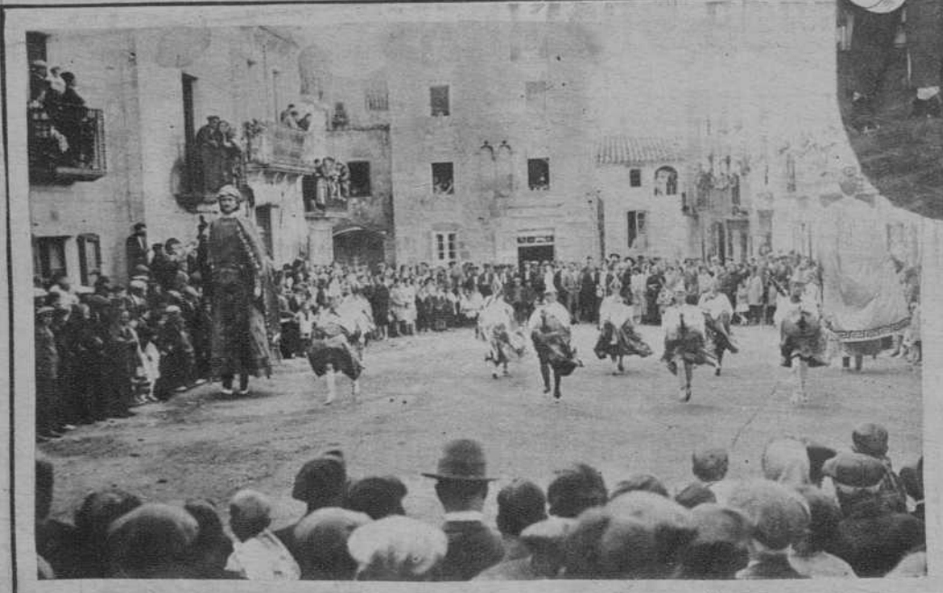
SAN FELIU DE PALLAROLS.—Los gigantes y caballetes bailando «La matadegollas»