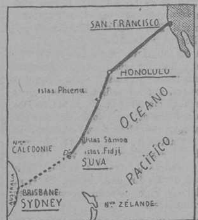
Gráfico del vuelo del «Southern Cross»

En opinión de Lindbergh, el vuelo del "Southern Cross" sobre el Pacífico, es la más grande hazaña aviatoria realizada hasta ahora