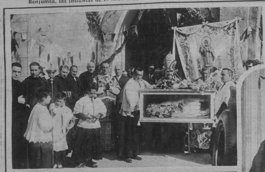
SAN SEBASTIAN.—Llegada a Roma de los restos de Santa Columba, que serán venerados en la capilla de Herrera.