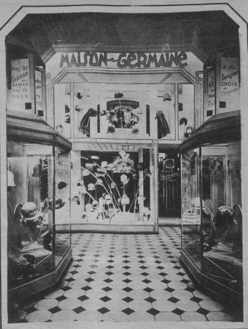
En los escaparates de «Maison Germaine» se exhiben los múltiples modelos de sombreros que la moda lanza constantemente. Ellos son reflejo del arte y del buen gusto que imperan en todas las confecciones de tan acreditada casa