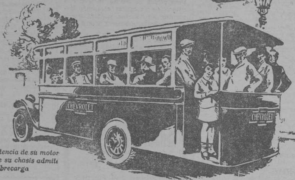
Por la gran potencia de su motor y resistencia de su chasis admite fácilmente la sobrecarga

CAMION CHEVROLET Fabricado por General Motors