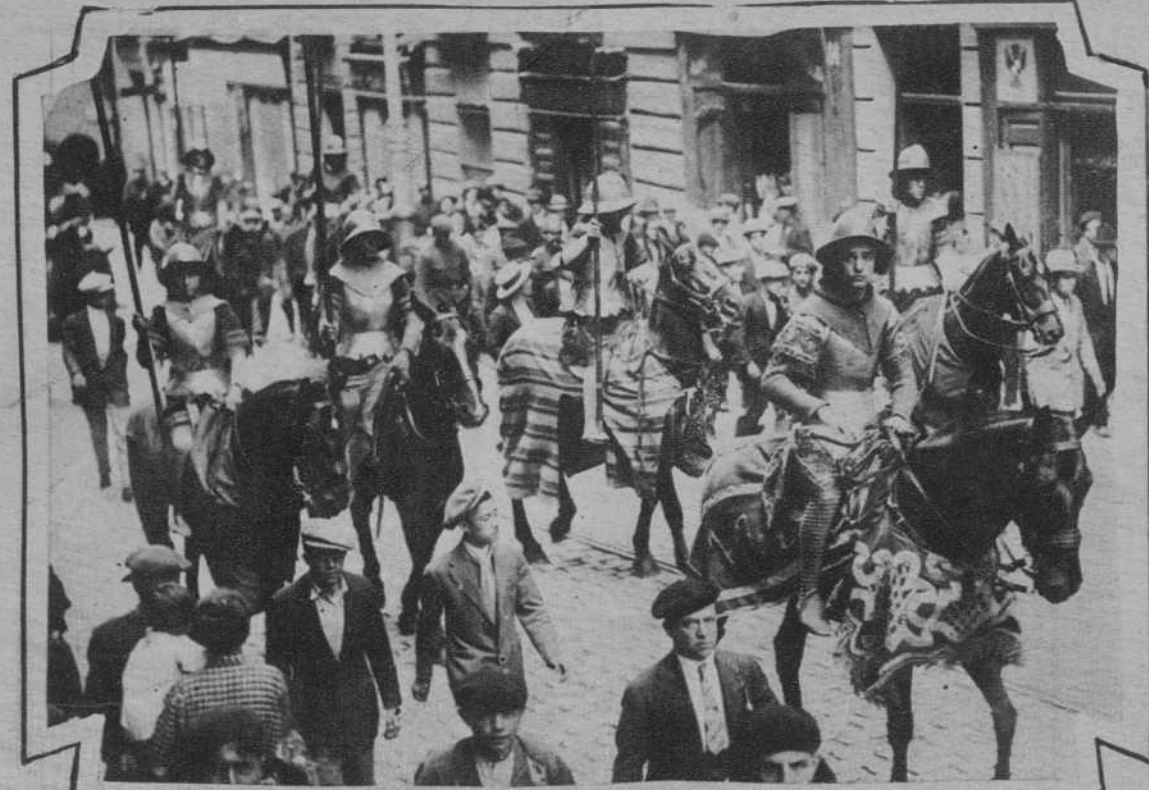
MADRID.—La cabalgata que ha anunciado las fiestas de Toledo.