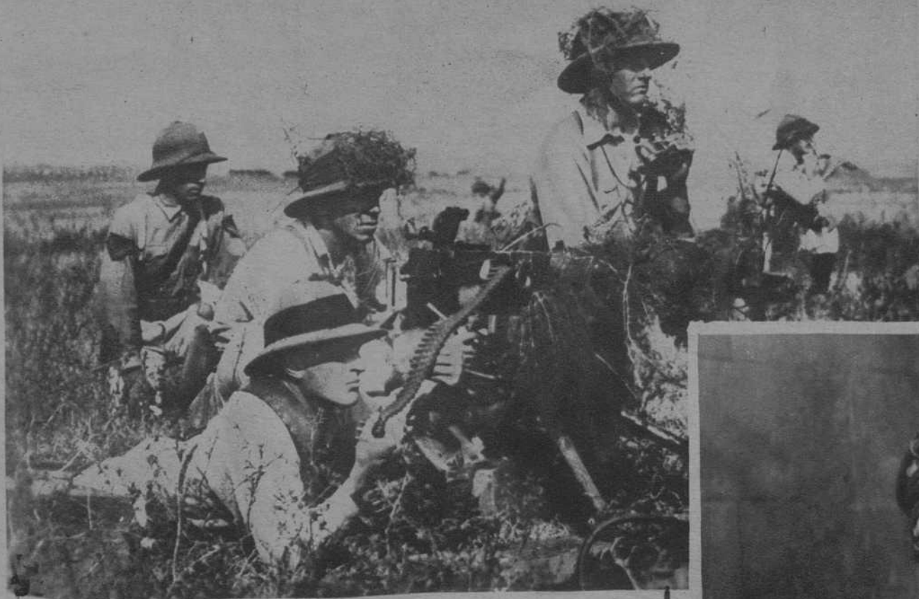
MANIOBRAS ARGENTINAS EN SUDAMERICA, NO MENOS QUE EN EUROPA, SE REALIZAN MANI- OBRAS MILITARES. HE AQUI UNA SECCION DE AMETRALLADORAS DURANTE LAS ULTIMAS MANI- OBRAS ARGENTINAS.