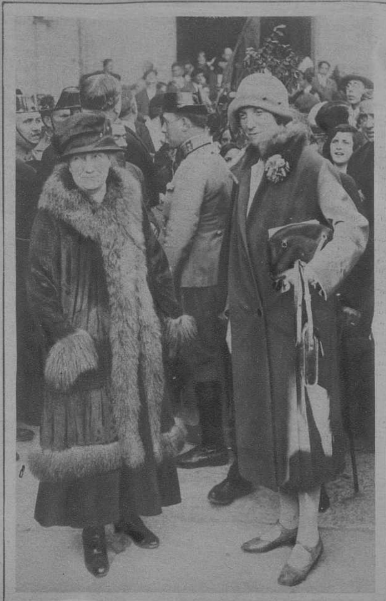
SANTILWANA.—La infanta doña Paz y su hija, la Princesa Pilar, al salir de la Colegiata.