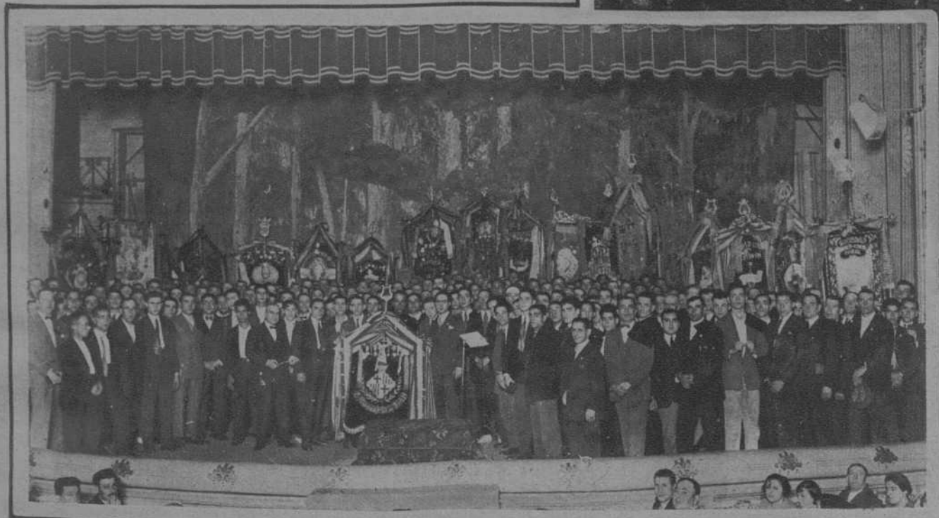
BARCELONA.—Coros reunidos en el Teatro Español en la función benéfica para los pobres organizada por «El Pensament d'En Clavé».