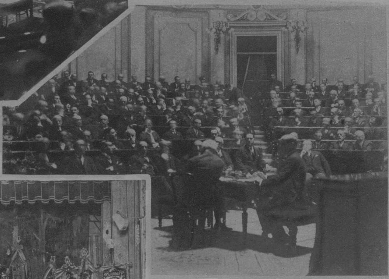
MADRID.—Aspecto del hemiciclo del Congreso durante la sesión de la Asamblea Nacional Consultiva. (Fot. Vidal).