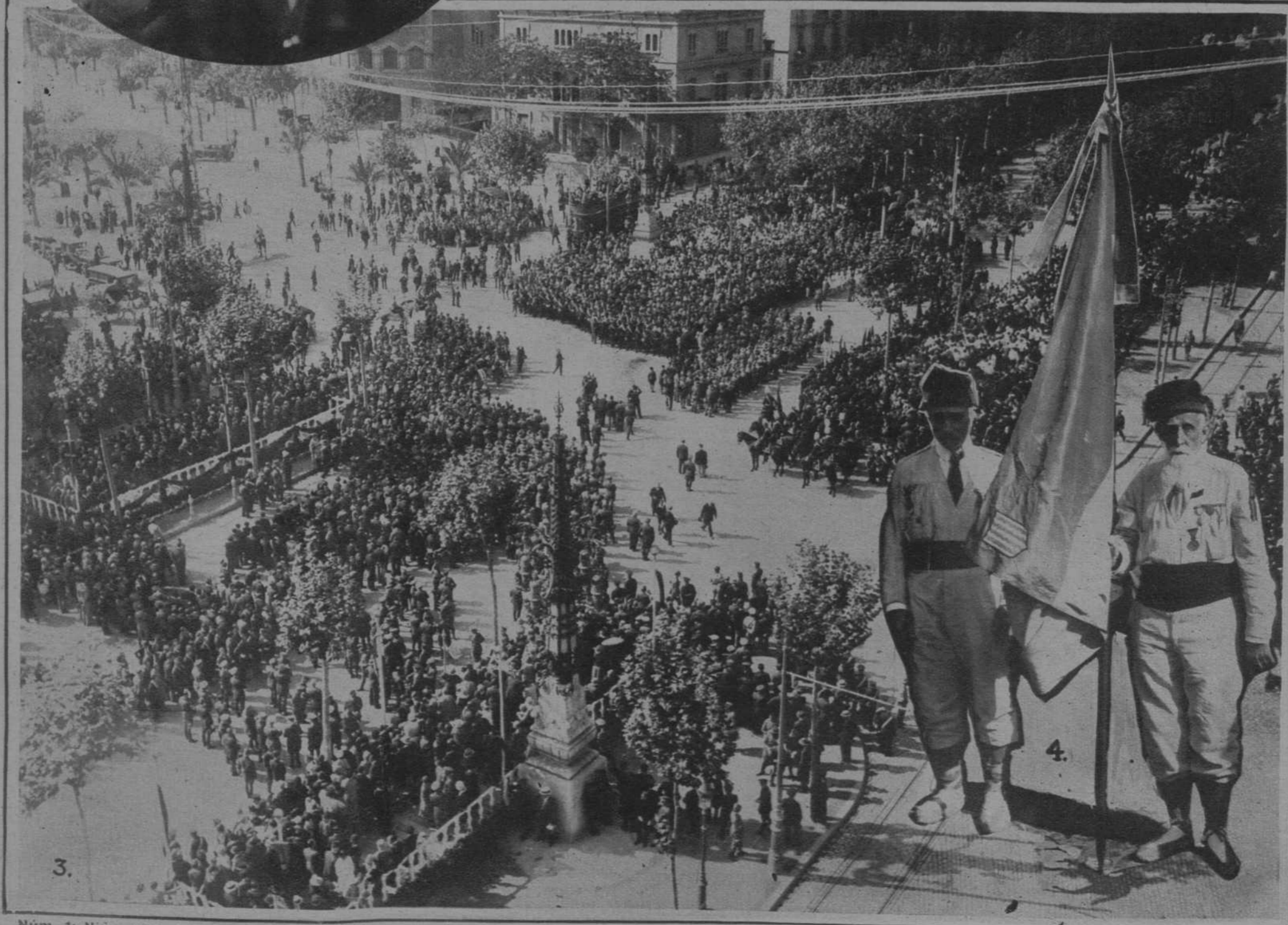
Núm. 1: Niños que representaban las Repúblicas americanas.—2: El general Despujols entregando los diplomas a los soldados licenciados de Africa.—3: Aspecto del Paseo de Gracia, cruce con la Avenida de Alfonso XIII, durante la misa de campaña.—4: Los dos únicos voluntarios catalanes que quedan de la guerra de Africa de 1860, que asistieron a la fiesta.