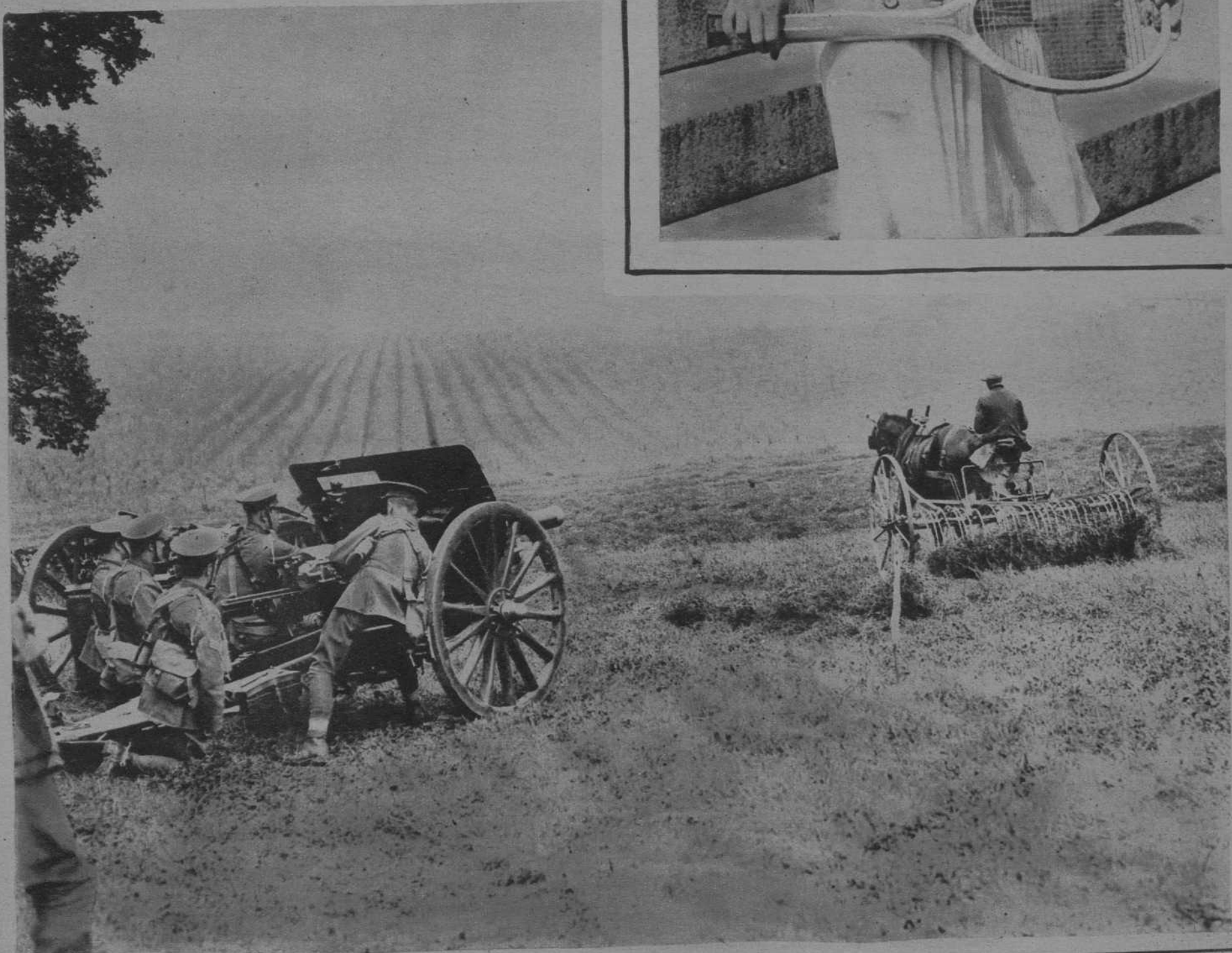
MANIOBRAS INGLESAS PAZ Y GUERRA, EL CARON JUNTO A LA MAQUINA SEGADORA, EN EL LLANO DE SALZBURG. (Fot. Keystone).