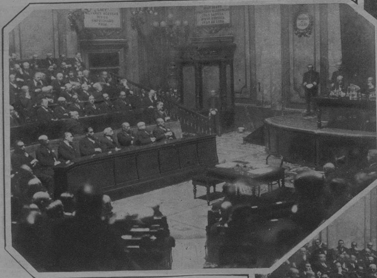
MADRID.—El Rey en la Asamblea Nacional Consultiva.