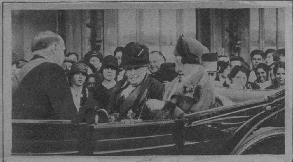
ZARAGOZA.—Llegada de la Infanta Isabel.