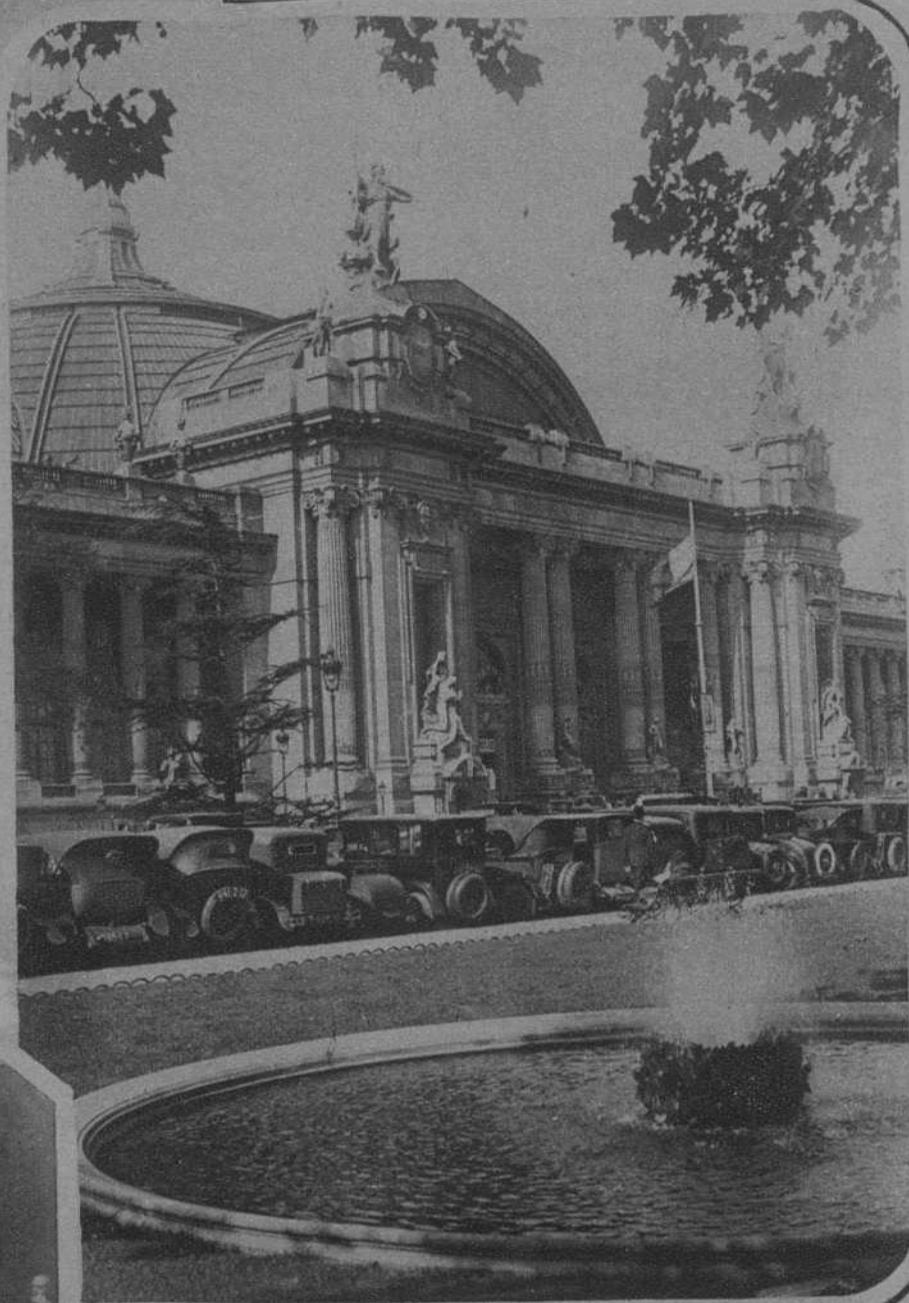
PARIS.—Aspecto de los alrededores del Grand Palais, ocupados por los vehículos de los visitantes del Salón del Automóvil.