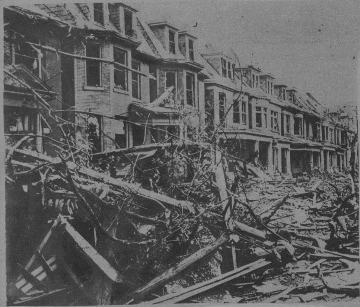
SAN LUIS (EE. UU.)—Un grupo de casas después del terrible ciclón que devastó recientemente la comarca del Missouri.