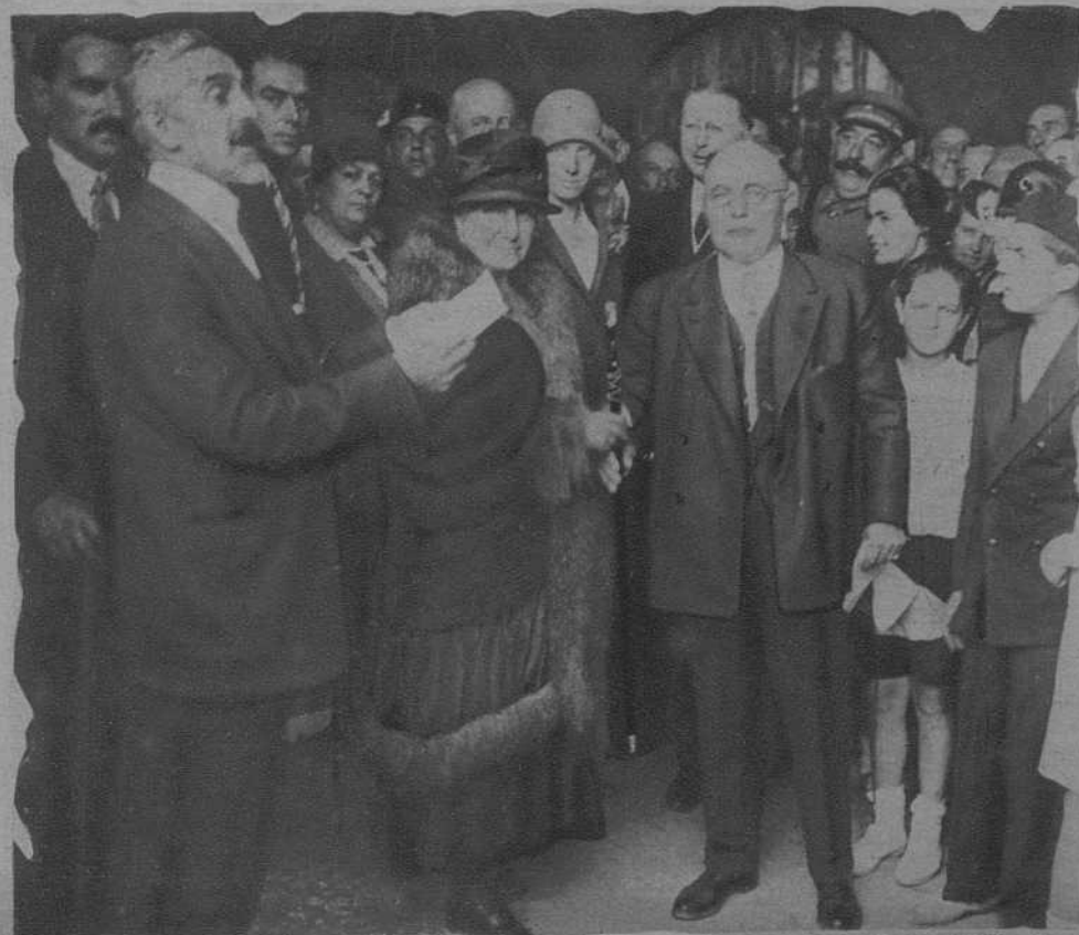
SANTILLANA.—La Infanta recibe de manos del alcalde la llave del palacio que le regalará, y el bastón de alcaldesa.