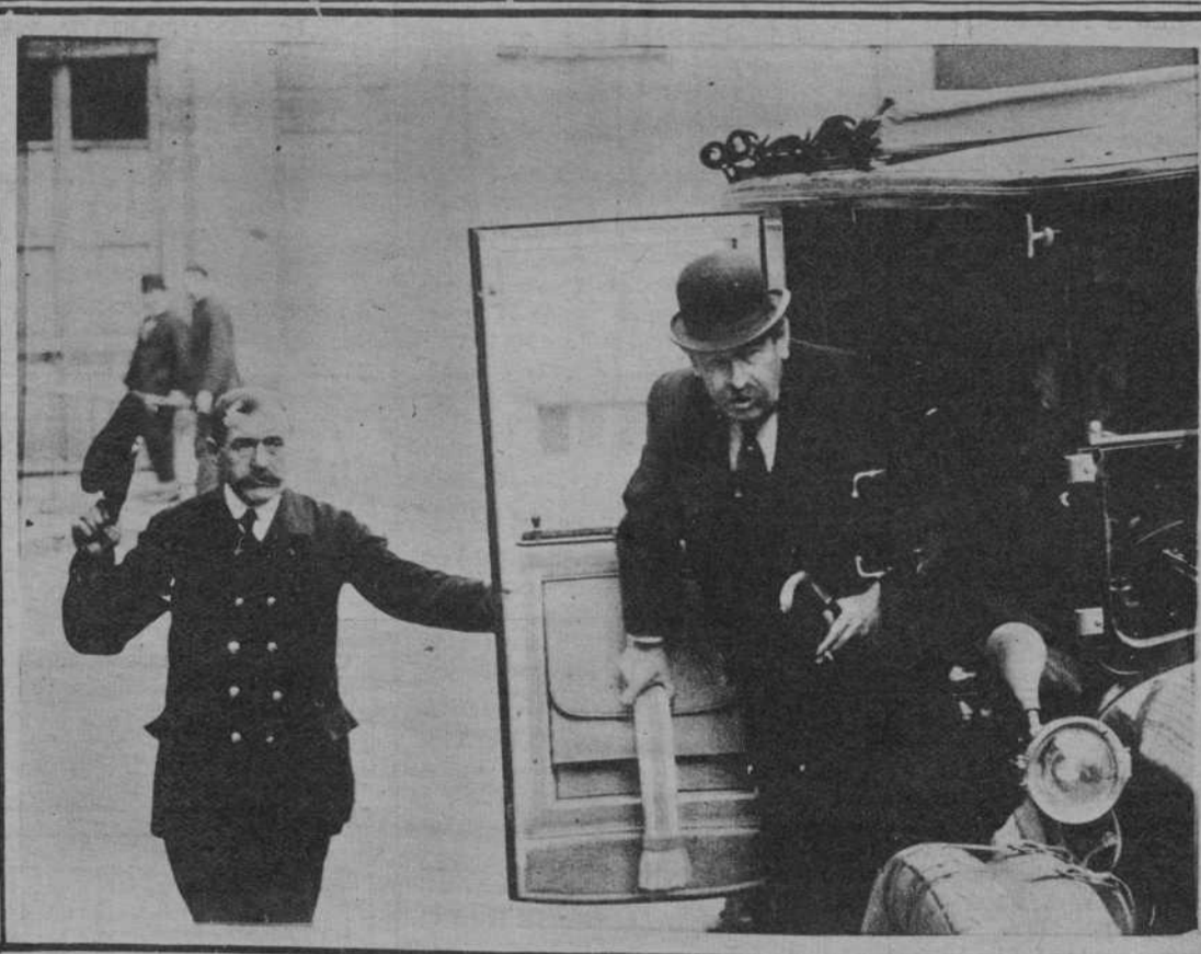
Actualidad francesa: El viaje a Lyon de M. Doumergue: El Presidente, junto con M. Herriot, durante la recepción celebrada en el Ayuntamiento. La crisis: M. Briand acude al llamamiento del Presidente de la República, que le encarga de nuevo la formación de Gabinete, aceptando.