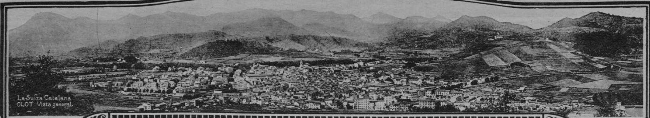
La Suiza Catalana OLOI Vista general.

REDACCION, DIRECCION COMERCIAL Y ANUNCIOS. Plaza de Cataluña, 9 - Tel. 2599 A TALLERES IMPRENTA, CONTABILIDAD, COMPRAS, ANUNCIOS, RECLAMACIONES. Muntaner, 49 - Tel. 2322 A