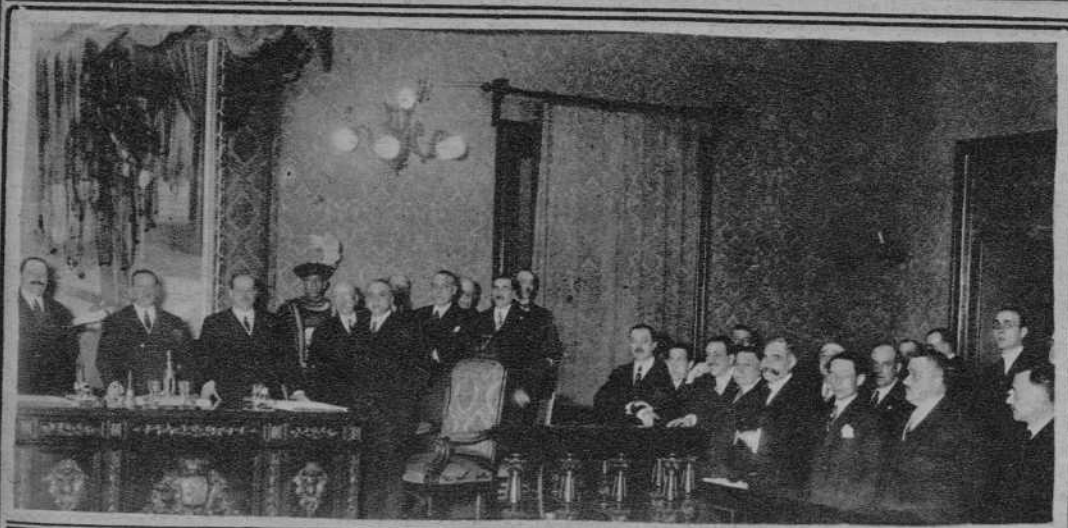
Madrid - Sesión inaugural de la Asamblea de Diputaciones, presidida por el ministro de la Gobernación