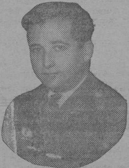
EL COMANDANTE FRANCO

Inmediatamente el aparato quedó custodiado por doce vecinos que montarán guardias hasta la hora de la partida, igual que se hizo con las carabelas de Colón.