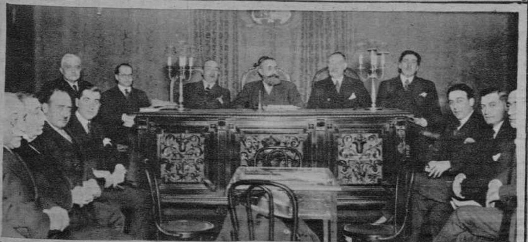
Madrid - Sesión inaugural de la Asamblea forestal y maderera de España