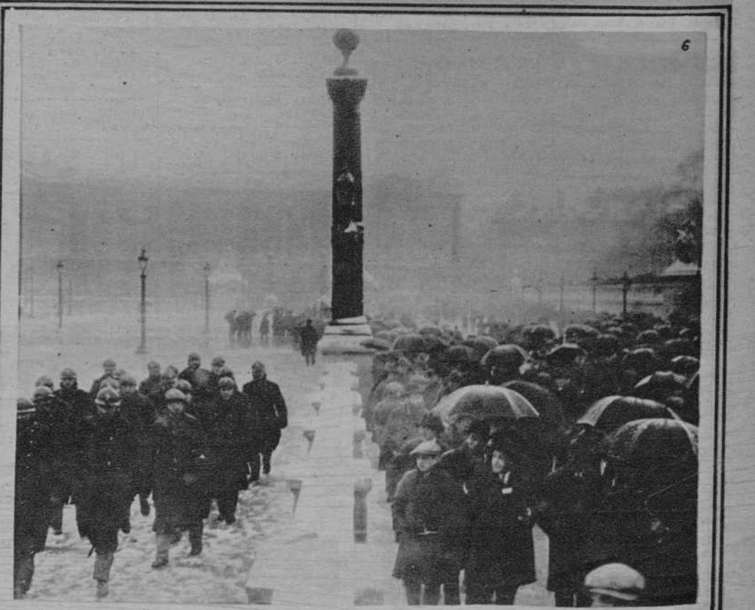
Notas de la capital de Francia: La nieve: 1. Una vista de París cubierto por la nieve: 2. Los pájaros en el jardín de las Tuillerías buscando el alimento que no hallan: 3. El deporte en el campo.....: 4..... el deporte callejero: 5..... 4 a durante la manifestación de los funcionarios. (f. Meunier)