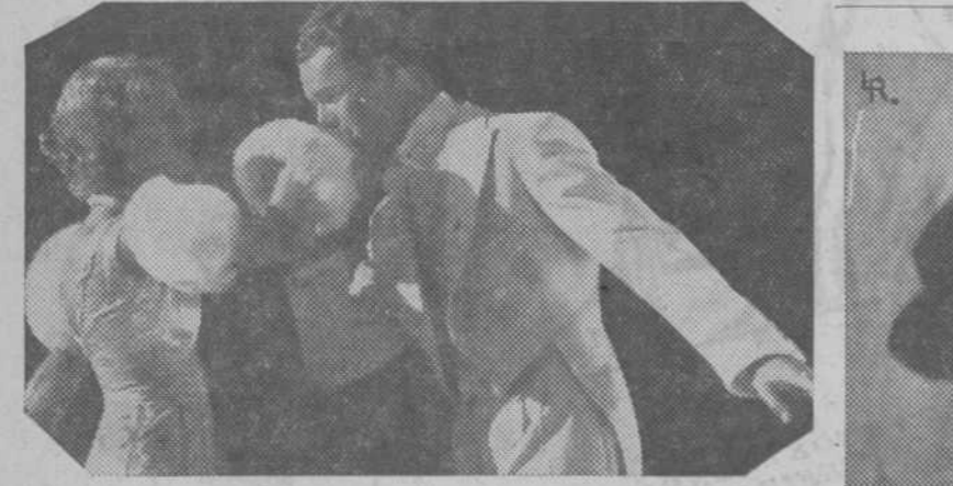
Fred Astaire y Ginger Rogers en la grandiosa superproducción Radio "La alegre divorciada", que dentro de breves días se estrenará en Madrid