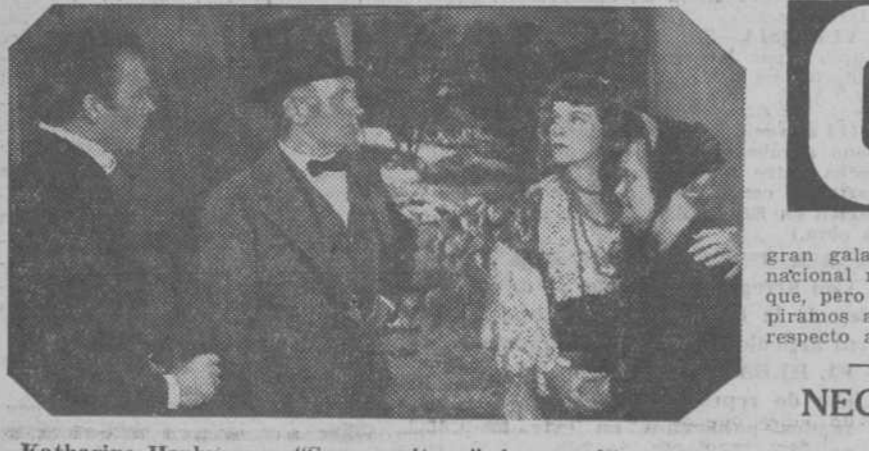
Katharine Hepburn en "Sangre gitana", la magnífica superproducción Radio Films que triunfa diariamente en el Avenida

San Francisco de Asís Mañana viernes celebran su santo las marquesas de Casa Muñoz, Colomina, Guaimar y Justiz de Santa Ana. Condesas de Castañeda, Humanes y Turubia.