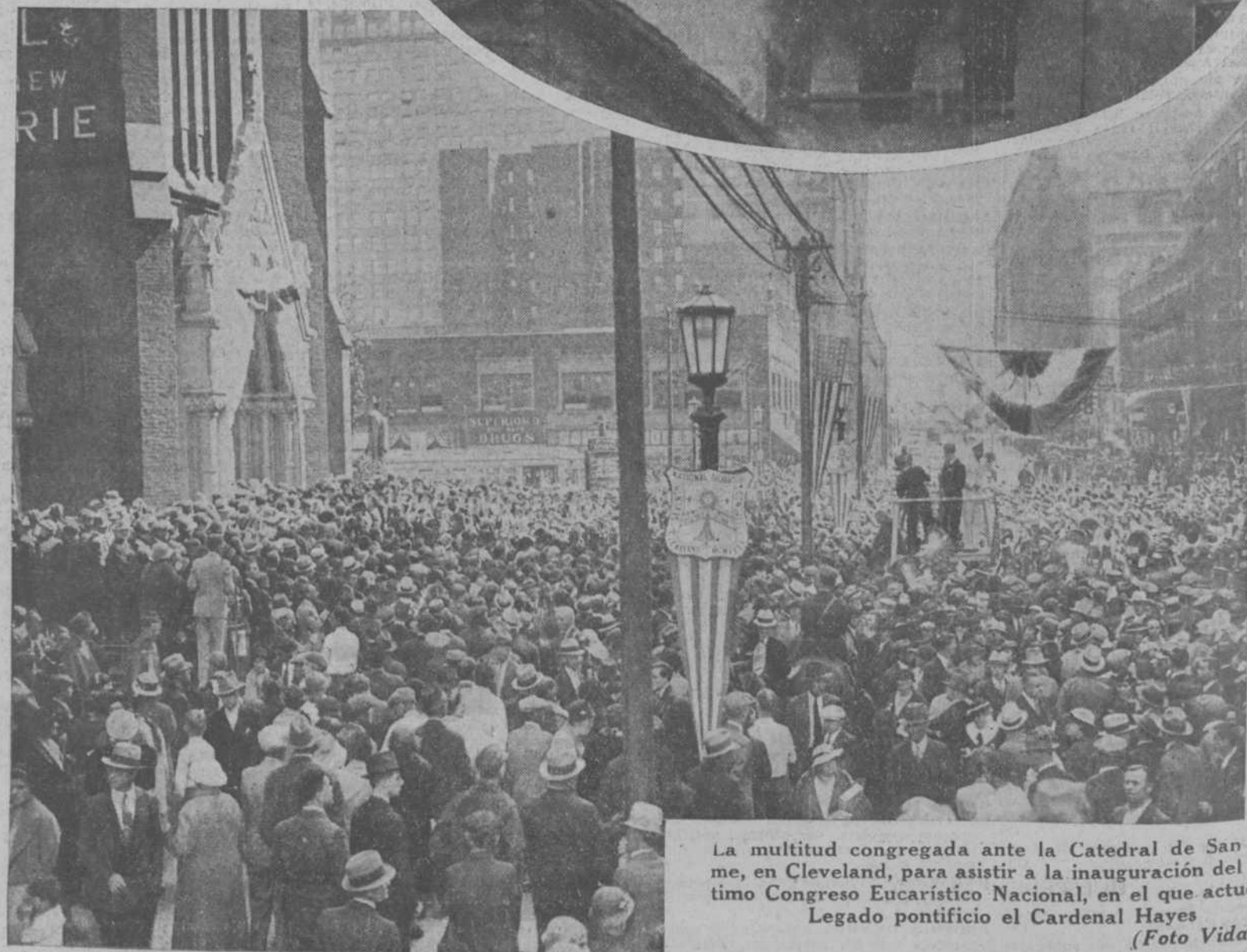
La multitud congregada ante la Catedral de San Jaime, en Cleveland, para asistir a la inauguración del séptimo Congreso Eucarístico Nacional, en el que actuó de Legado pontificio el Cardenal Hayes