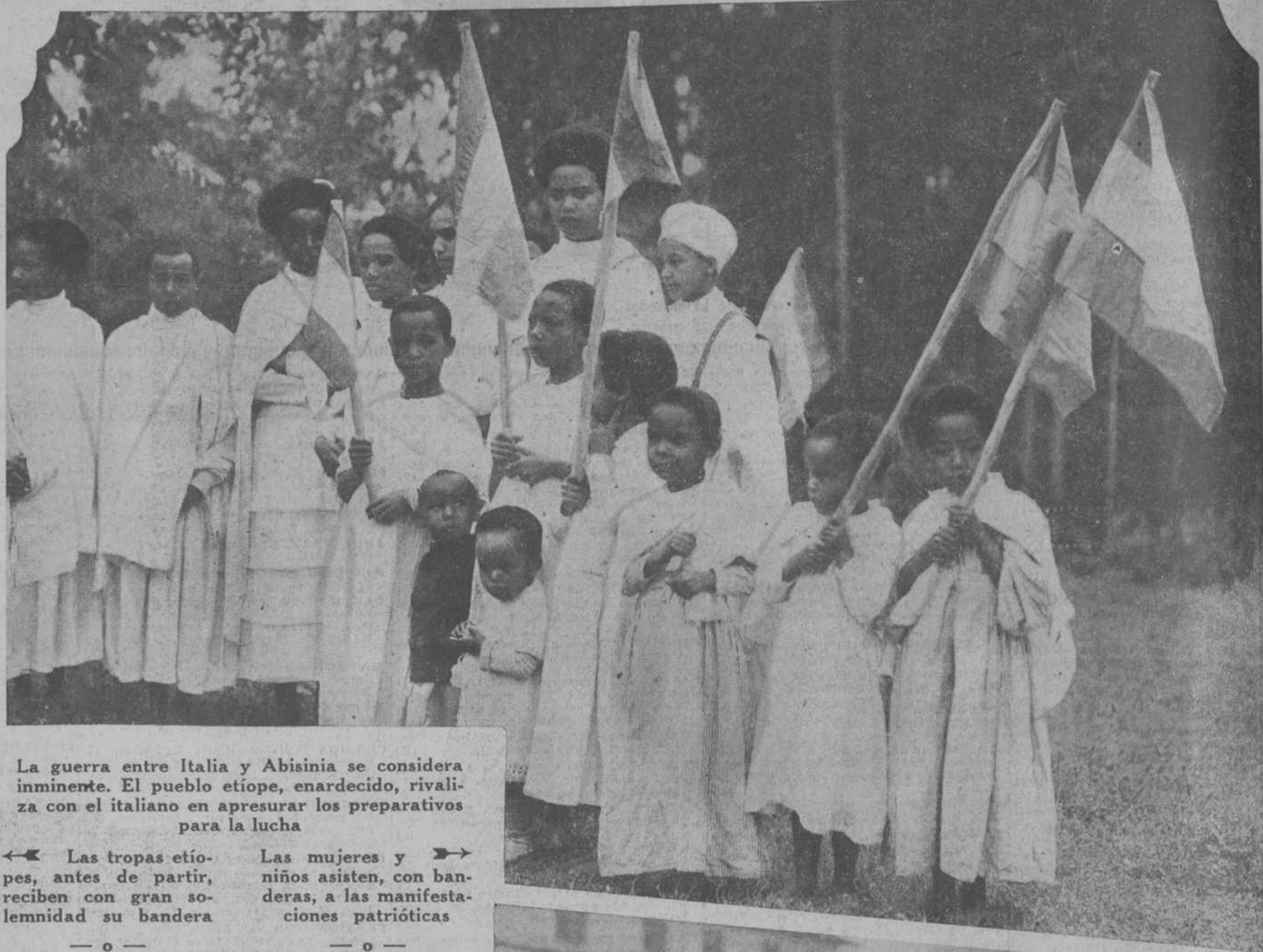
La guerra entre Italia y Abisinia se considera inminente. El pueblo etiope, enardecido, rivaliza con el italiano en apresurar los preparativos para la lucha