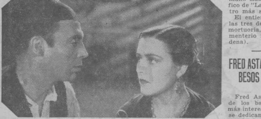
Imperio Argentina en una escena de "Nobleza baturra", la magnífica realización de Florián Rey, para Cifesa