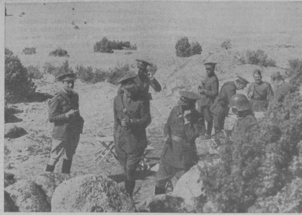
Jefes y oficiales del Estado Mayor que, al mando del general don Bernardino Mulet, han dirigido las maniobras militares celebradas en Manzanares

PARIS, 2.—Paris Solr publica un despacho de Addis Abeba, en el que anuncia que las tropas italianas que han pasado la frontera y penetrado en la región de Aussa, son tres columnas que representan una fuerza total de veinte mil hombres. Inmediatamente se produjeron los primeros encuentros entre los soldados italianos y soldados de las