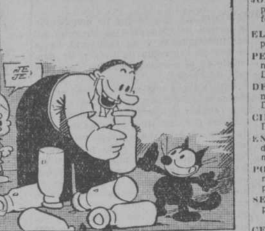
—Desde el puente he presenciado todo y te felicito por ello.