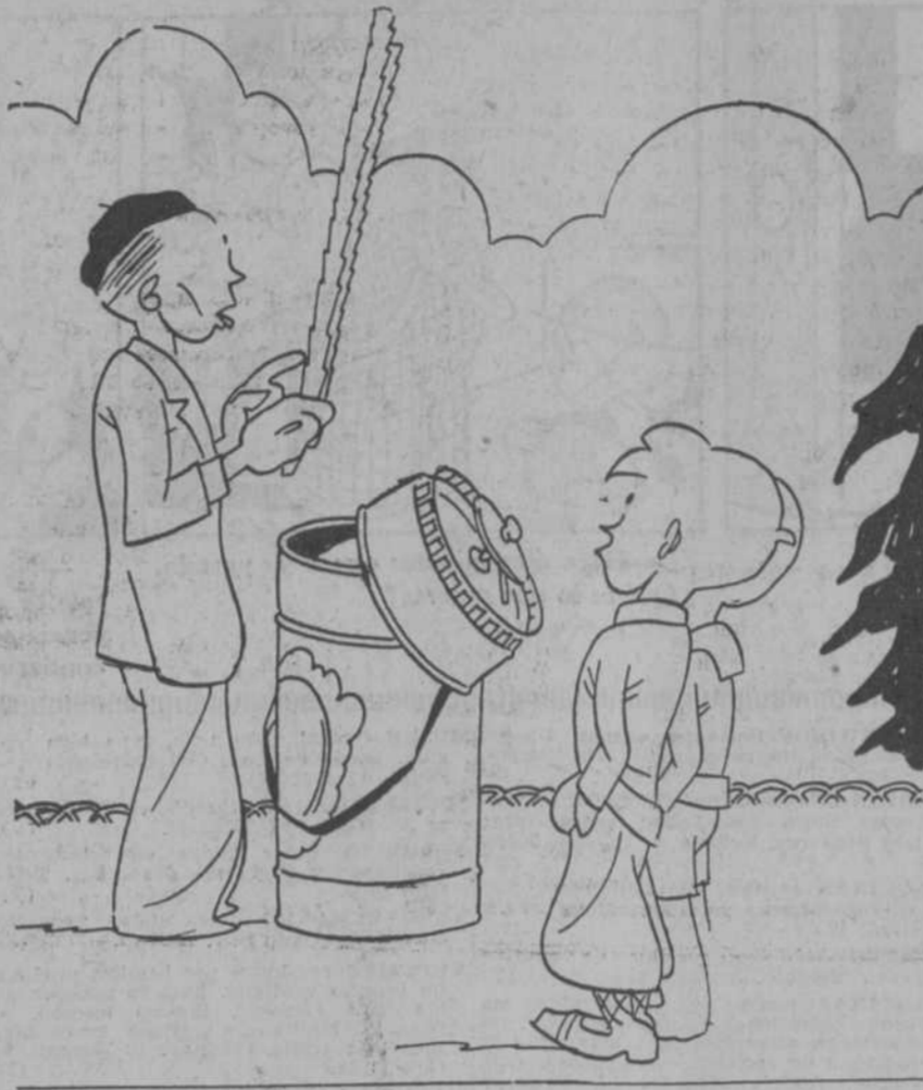
—¿Lo ves? Una demostración naval por dos gordas.