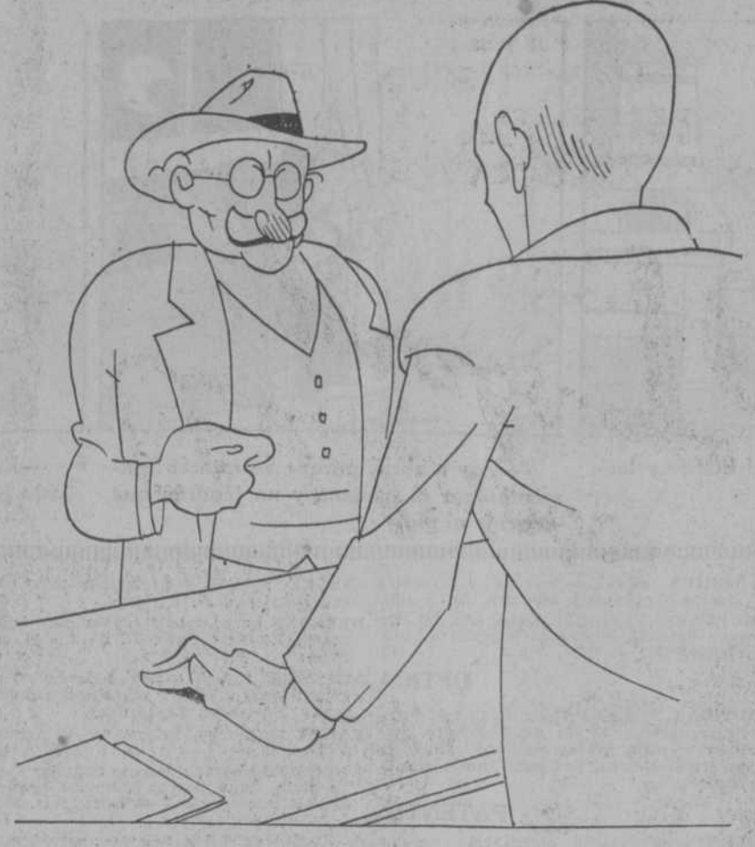
—¿Qué desea el señor? —Un ciento de tarjetas