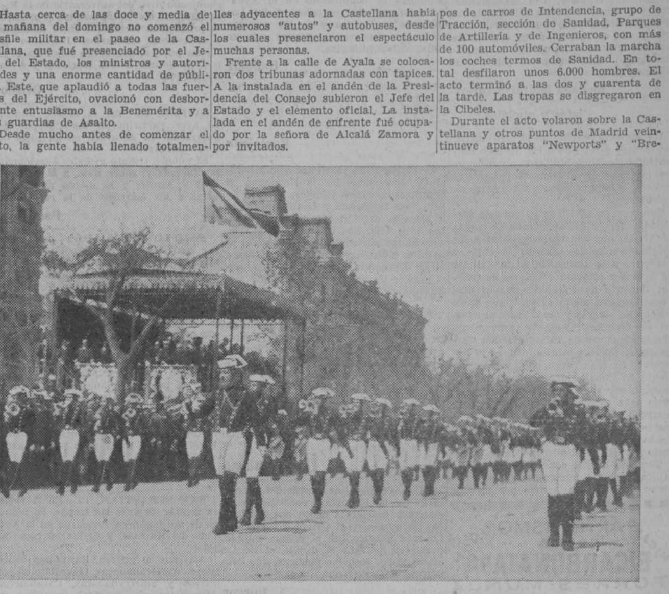
Los niños del Colegio de la Guardia civil de Valdemoro, en el desfile del domingo por el Paseo de la Castellana, durante el cual fueron objeto de grandes ovaciones