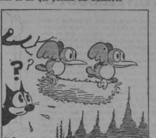
—¿No te parece que es una pena dejar nuestro nido?