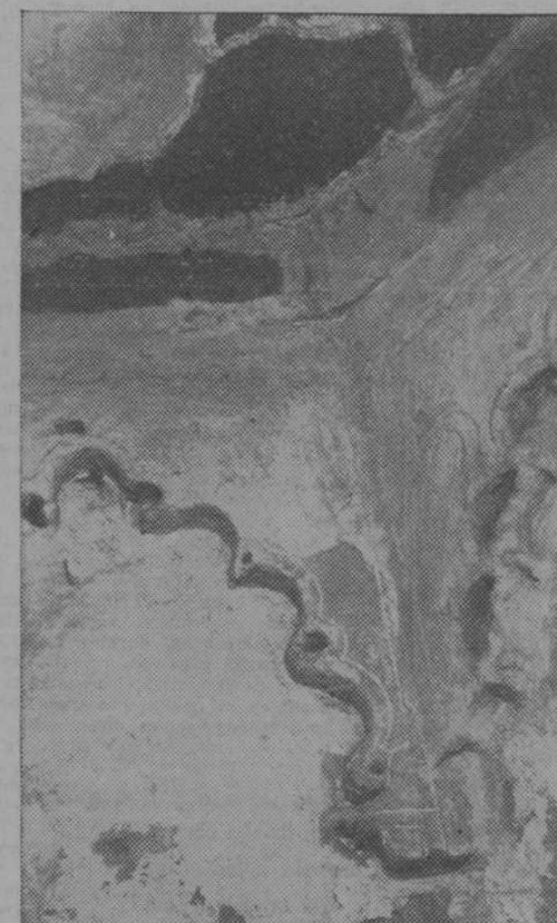
Arriba: Arcos de yeso en el "mihrab" de la primitiva mezquita mayor de Almería. A la derecha: Arcos con decoración en los llamados "Cuartos de Granada", pertenecientes a los actuales descubrimientos realizados por don Leopoldo Torres Balbás en la Alcazaba de Málaga.

importantísimos descubrimientos que esclarecen puntos oscuros de nuestro pasado histórico y acrecen el tesoro artístico nacional. Recientemente, en la zona Este-Sur del servicio de conservación monumental—a cargo del prestigioso arquitecto señor Torres Balbás—, se han realizado importantes trabajos de exploración y restauración, que han tenido como re-