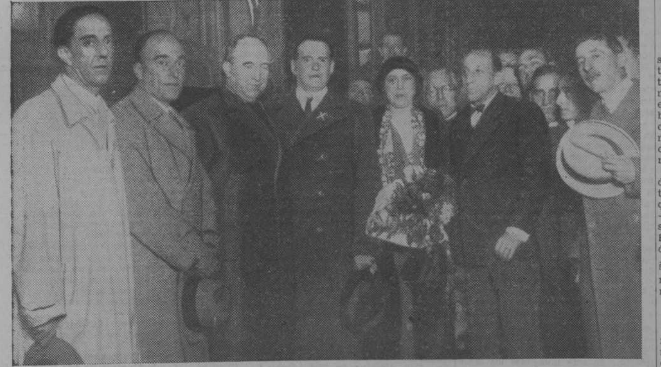
Alekhine, el campeón mundial de ajedrez, al llegar anoche, acompañado de su esposa, a Madrid, donde realizará algunas exhibiciones

Es probable que dé una conferencia en el Casino de Madrid