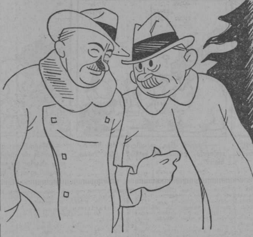
—Y, ¿qué me dice usted de esa Comisión investigadora formada por Negrin, Aguilera, Atanasio de Gracia y Matilde la Torre? —Pues... que tiene gracia.