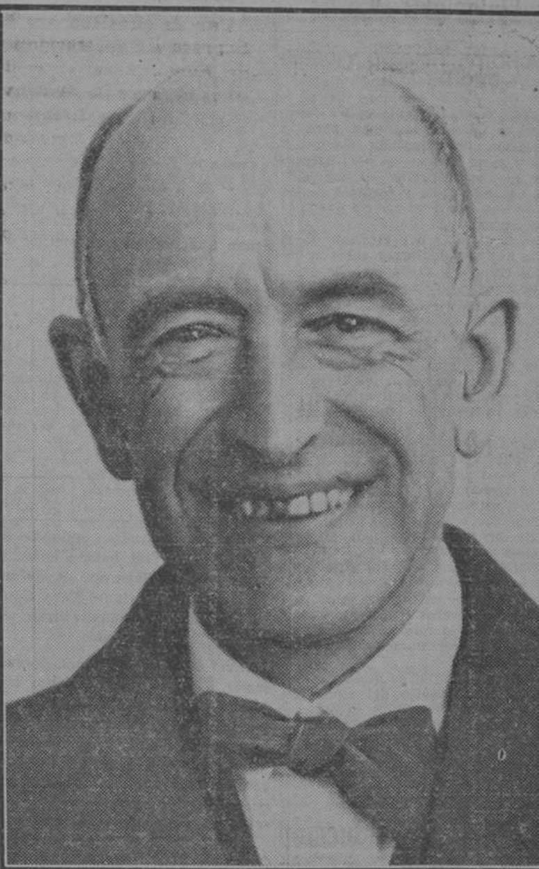
El ilustre compositor don Manuel de Falla, que ha sido designado académico correspondiente de la de Bellas Artes de París

Carta del Papa a la Orden de la Merced SE CELEBRA AHORA EL VII CENTENARIO DE LA APROBACION PONTIFICIA