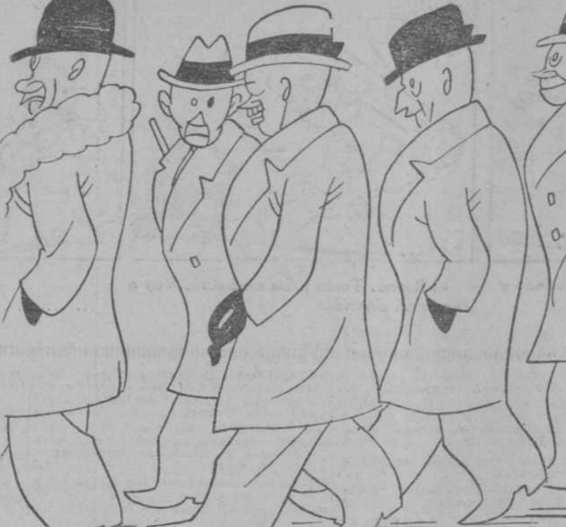
—Ya ves; la pobre Segunda con entierro de tercera. —Por lo visto ha sido una imposición de la prima.