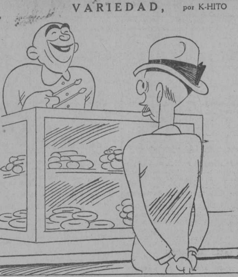
—¿De crema? ¿De hojaldré? ¿O lo quiere usted jurídico, acabadito de salir del horno?

(NOVELA) (Traducción expresamente hecha para EL DEBATE por Emilio Carrasosa.)