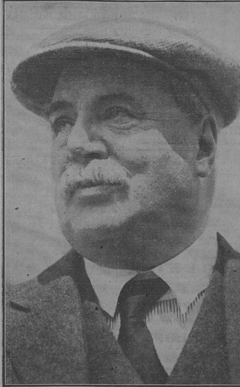
Lord Derby, cuyo caballo "Hyperion" ganó la carrera más importante del mundo

En todo el mundo deportivo no hay una figura tan popular como Lord Derby. Mucho más que los Vanderbilt, Lipton, Rothschild, etc. Multimillonario como ellos, dotó y sigue dotando con buenos premios muchas pruebas de toda clase de deportes. Pero donde más se destaca su personalidad es en el "tur". Es el propietario por excelencia, de esos a los que basta el honor del triunfo y no le importa nada, en el calor del entusiasmo, entregar el cheque del premio—de ocho mil a diez mil libras—al jinete que ha conducido victorioso a su caballo. Por sus antecesores, lleva su nombre la carrera más importante del mundo, que es la que acaba de ganar. Es la segunda vez. La primera vez fue el año 1924, con "Sanovino". Admitidos sus grandes conocimientos hípicas, ha vuelto a demostrar que es un gran pronosticador. En efecto, algunos días antes del Derby se celebró un banquete, al que asistieron todas las personalidades del "tur", y en esa ocasión todos pronosticaron, como en 1924, pronosticó el triunfo de su caballo. Y acertó.