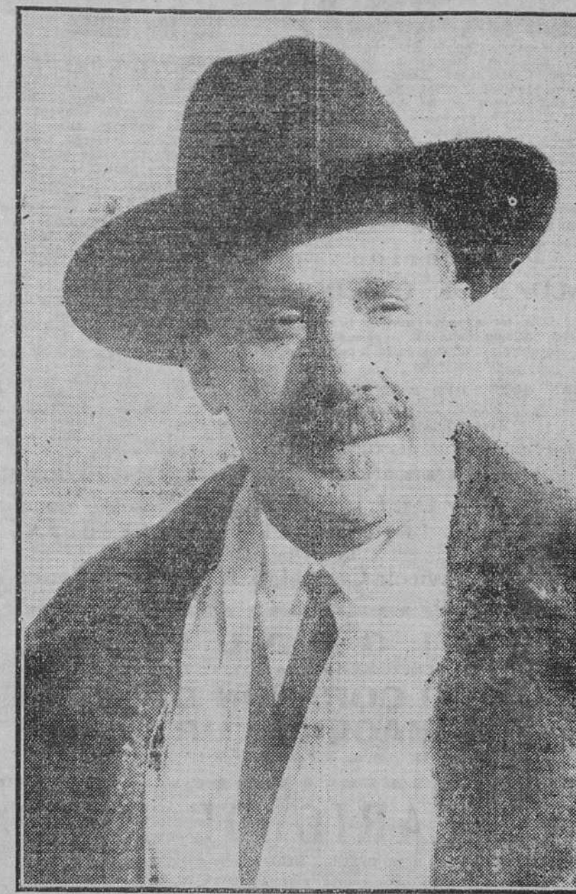
Don Ignacio Zuloaga y Zabaleta, que ha sido elegido académico de Bellas Artes

Fué Zuloaga, casi desde el principio de su carrera, uno de los valores artísticos de España de más prestigio en el extranjero, donde su pintura amplia y jugosa, a veces honda de pensamiento, se impuso. En su manera de ver y fijar asuntos nacionales, puede observarse como una concesión al afán de pintoresquismos, al concepto de una España trágica y sombría, pero estas concesiones, sobre llamar la atención hacia nuestra Patria, le aseguraban crédito cuando la mostraba tal como es y la reflejaba con amor y con verdad.