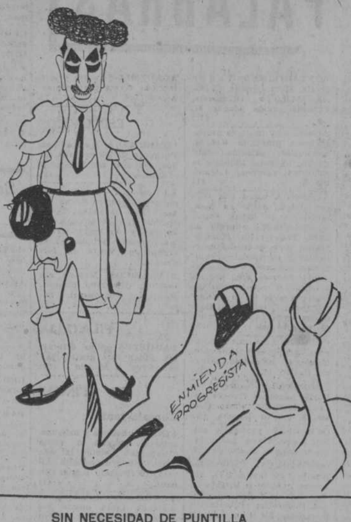
SIN NECESIDAD DE PUNTILLA