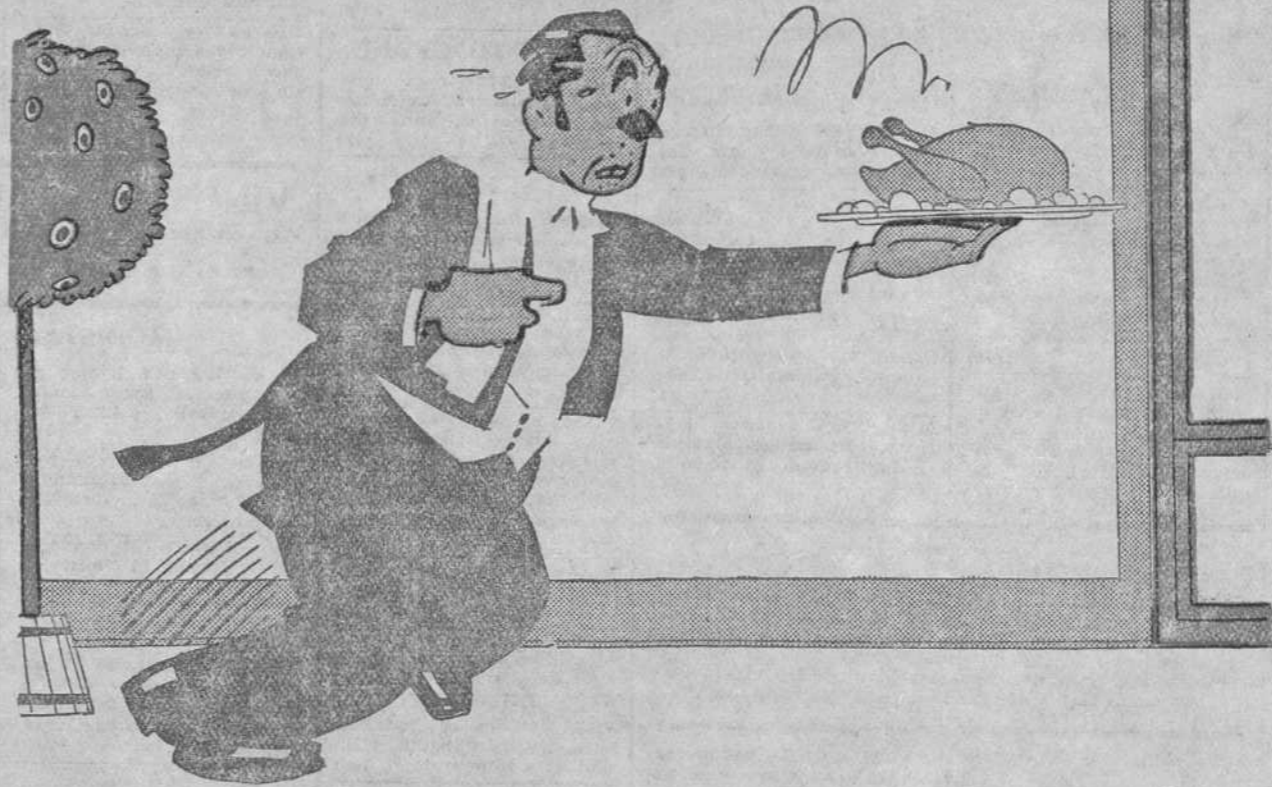
—Pues, señor, ¡y eso que todos son tan amantes del régimen!