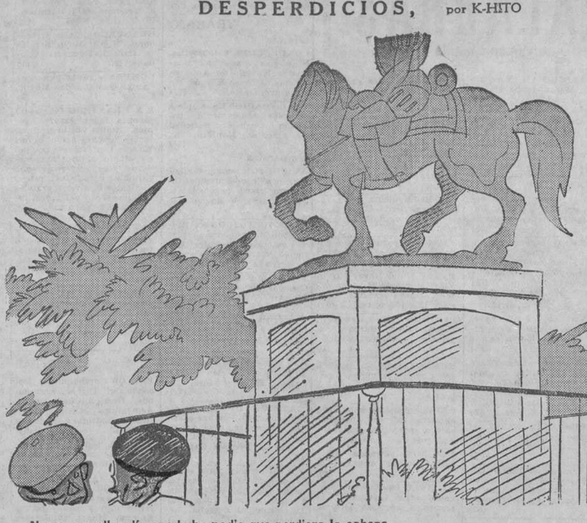
No; en aquellos días no hubo nadie que perdiera la cabeza.