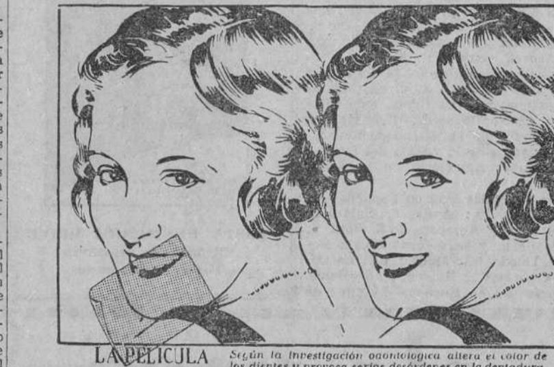
LA PELICULA Según la investigación científica altera el color de los dientes y provoca serios desórdenes en la dentadura.