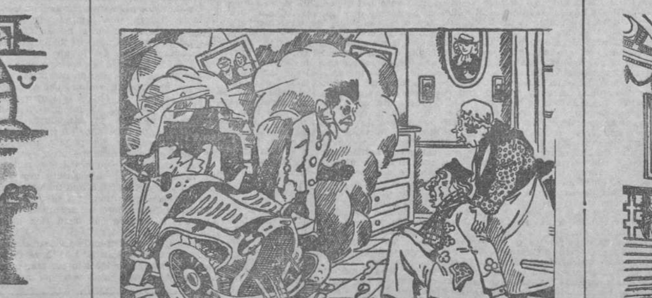
—Hola, querido papá! He venido directamente a felicitarte.