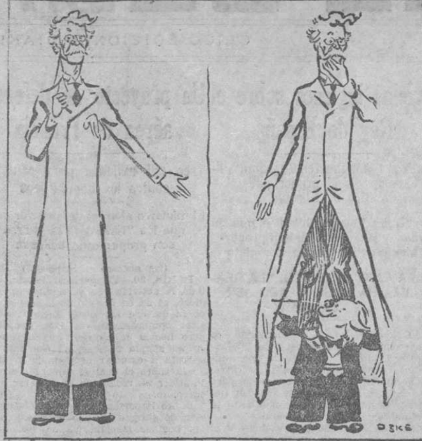
MACDONALD.—Puedo asegurar que los liberales no son el sostén del Gobierno.