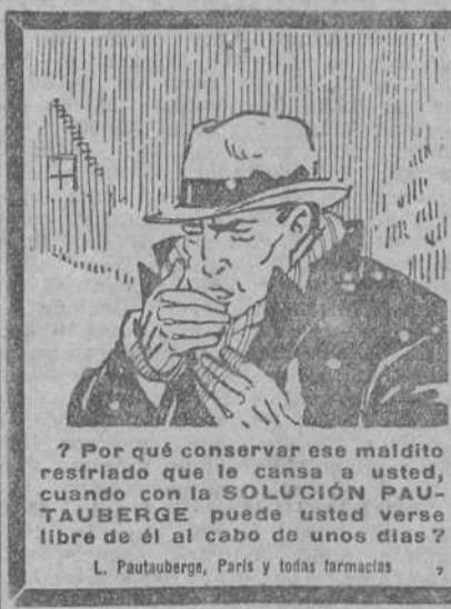
¿Por qué conservar ese malido restrido que le cansa a usted, cuando con la SOLUCIÓN PAU- TAUBERGE puede usted verse libre de él al cabo de unos días?

L. Paultauberge, París y todas farmacias.