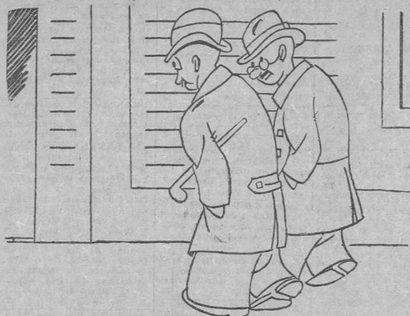
Cada día aprende uno algo nuevo; yo ignoraba que los marinos usasen capa.

Claro, hombre. Si no, ¿cómo iban a capear el temporal?