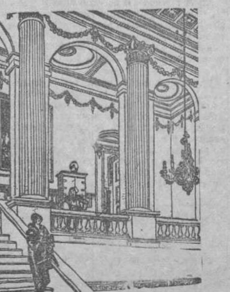
ELLA.—Basta! Me voy a casa de mi madre y abandono esta indecente choza.