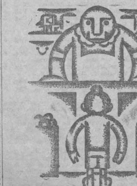
—Diez céntimos de queso. —No damos menos de medio kilo. —Bueno. Medio kilo por diez céntimos no está mal.

FERROL, 20.—Ha causado grata impresión en este departamento la designación para la cartera de Marina del almirante Ribera, considerado en la Armada como el jefe de la primera columna de tercera plana.