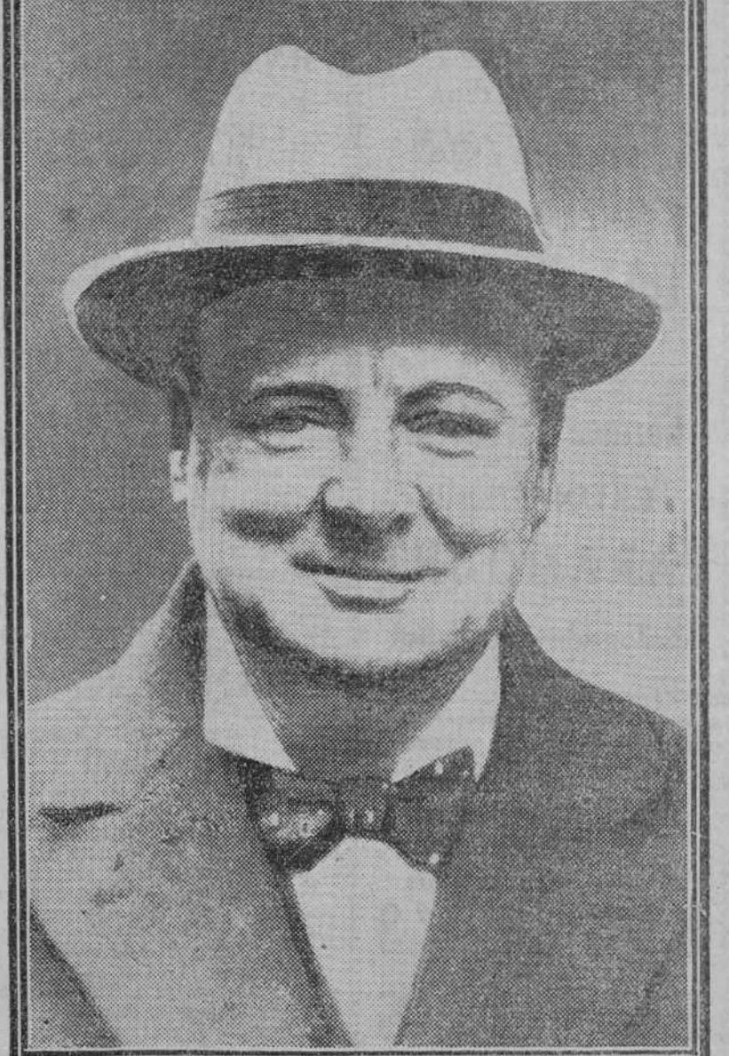
Churchill, ex ministro de Hacienda, que se separa del partido conservador inglés