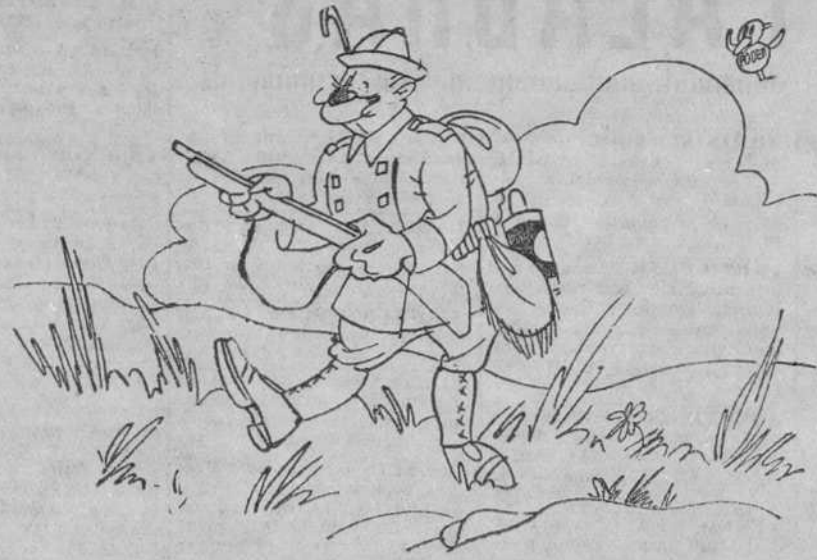
—La afición no me falta; lo que ocurre es que ahora no se me ponen a tiro.