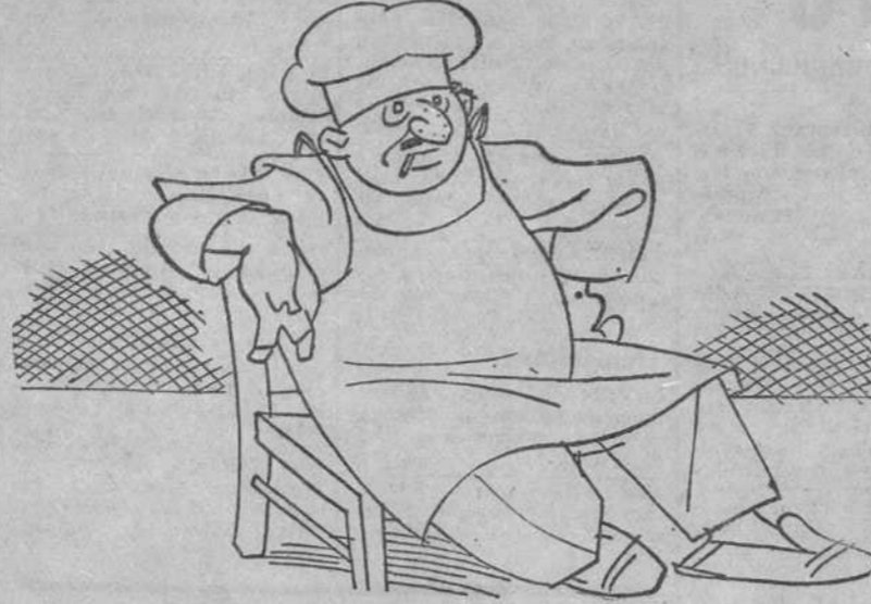
Una de las víctimas