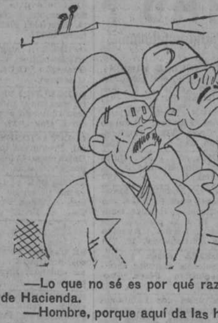
Lo que no sé es por qué razón lo han puesto en el ministerio de Hacienda.