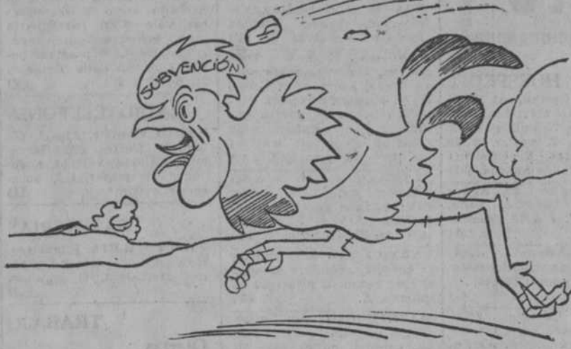
¡Caramba! ¡Siempre me dan en la cresta!