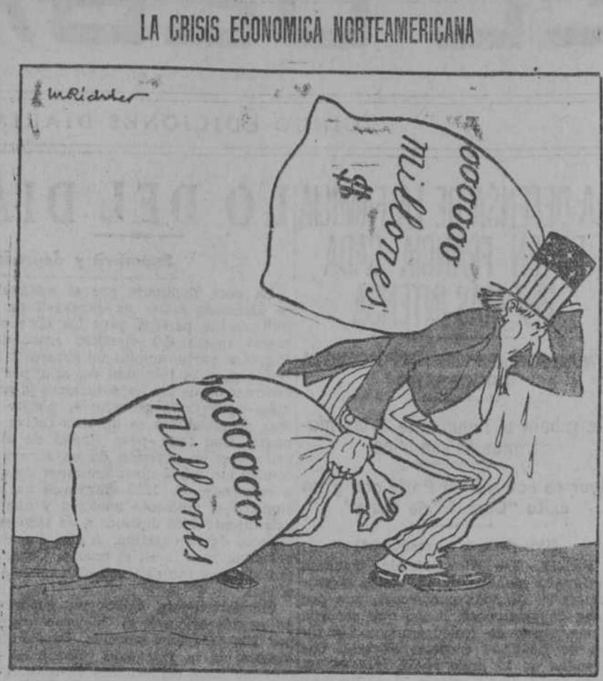
El ex presidente Coolidge dice que Norteamérica no debe soportar los gastos de la guerra ("Kladderadatsch", Berlín.)

Lea a diario nuestros anuncios por palabras, clasificados en secciones. En ellos encontrará diversas ofertas interesantes.