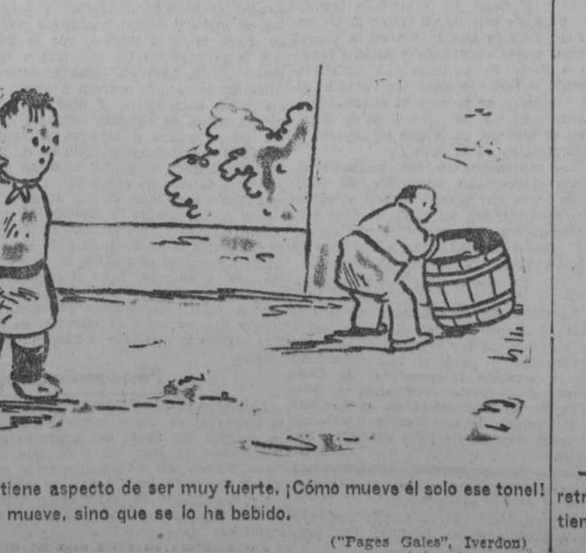
—Tu padre tiene aspecto de ser muy fuerte. ¡Cómo mueve él solo ese tonel!

EL SOLDADO.—Voy a leer un capítulo más, mi coronel, y en seguida apago.