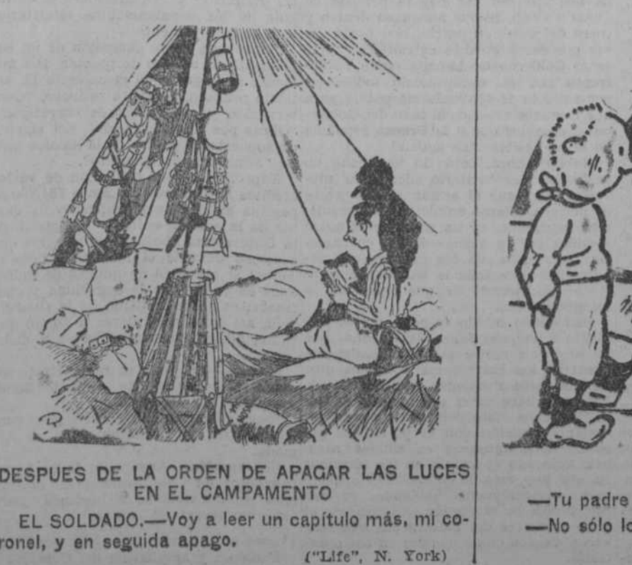
DESPUES DE LA ORDEN DE APAGAR LAS LUCES EN EL CAMPAMENTO

GINEBRA, 3.—Briand, presidente de la comisión encargada del estudio del proyecto francés sobre los Estados Unidos de Europa ha convocado a sus colegas el día 16 de enero.