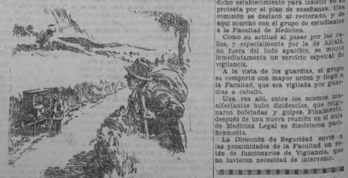
"Le Rire", Paris

—¡Pero hombre! ¿A quién se le ocurre ponerse a tocar el organillo en un camino desierto? —Es que estoy ensayando.