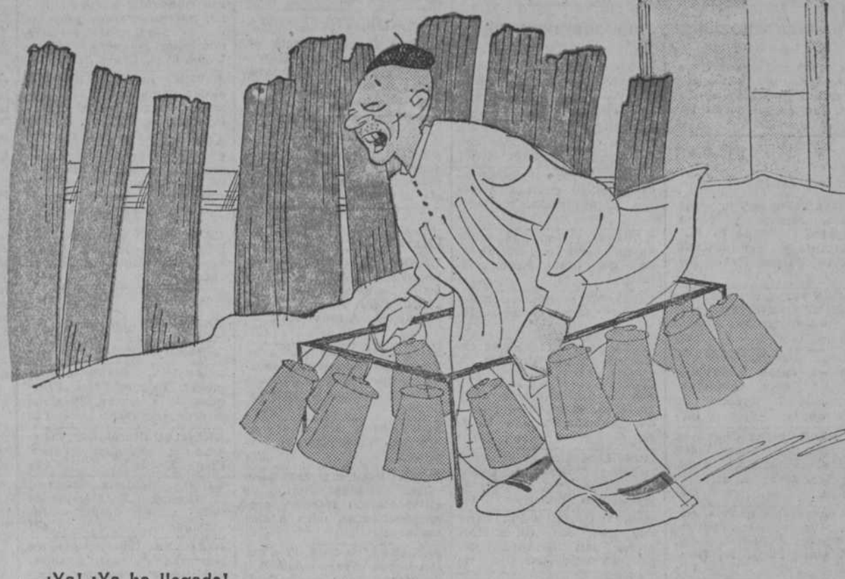
—¡Ya! ¡Ya ha llegado!