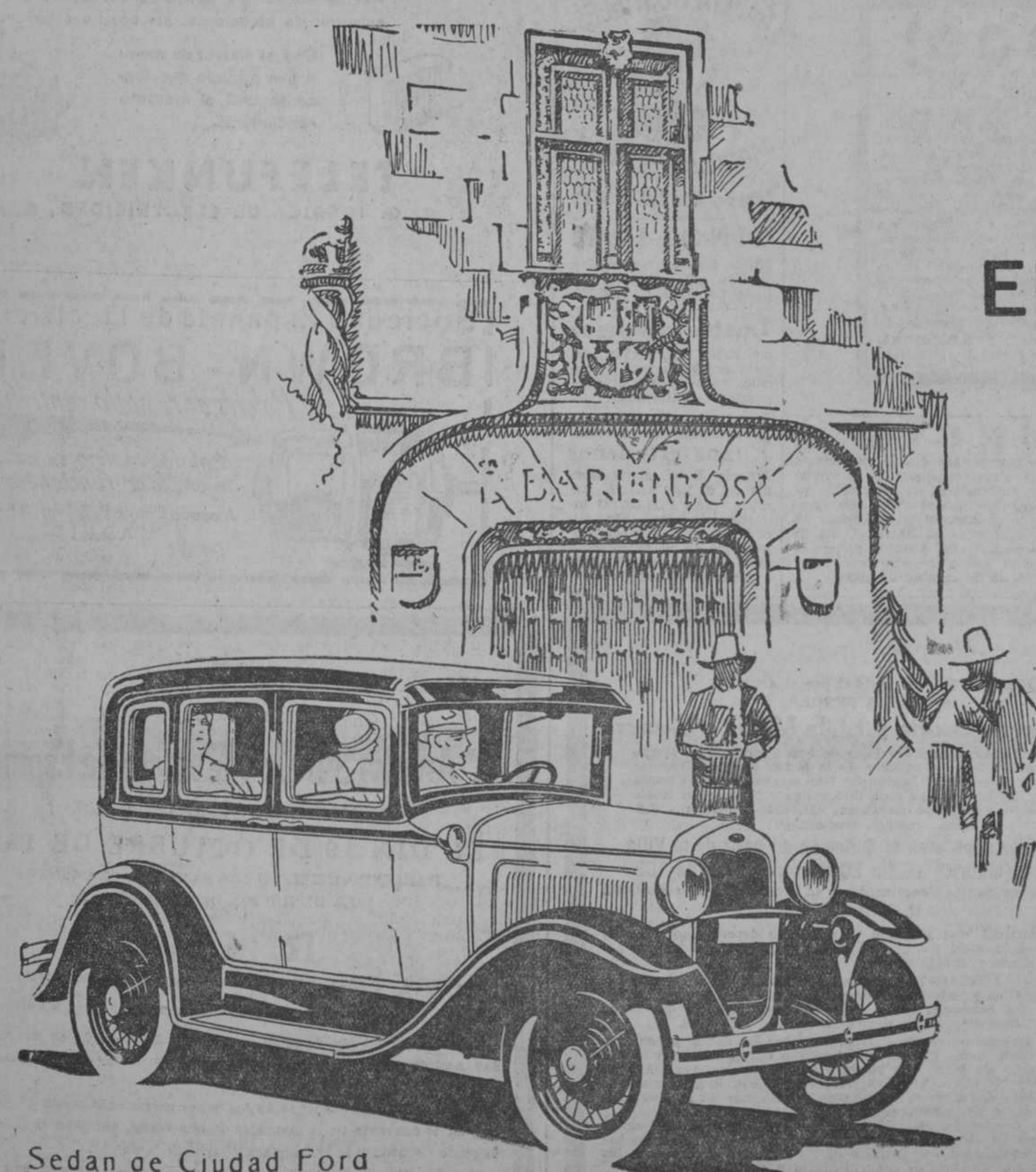
Sedan de Ciudad Ford

GRAN PELETERIA La Magdalena, Calle Mayor, 28. Presenta el mayor surtido en Abrigos, Renardés y Martitas. Precios increíbles. Teléfono 15763.