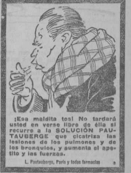
¡Esa maldita tos! No tardará en volver libre de ella si recurre a la SOLUCION PAUL TALEGERE que cicatriza las lesiones de los pulmones y de los bronquios, y aumenta el apetito y las fuerzas.

EL funeral que se celebrará en la iglesia de San Manuel y San Benito, mañana 22, a las once de la mañana; todas las misas del día 24 en Nuestra Señora de la Consolación (Valverde, 17); a las diez del día 23, en Santa Teresa y Santa Isabel (Chamberí), y las de ocho, ocho y media y nueve en Santa Bárbara, el día 25, serán aplicadas por el eterno descanso de su alma.