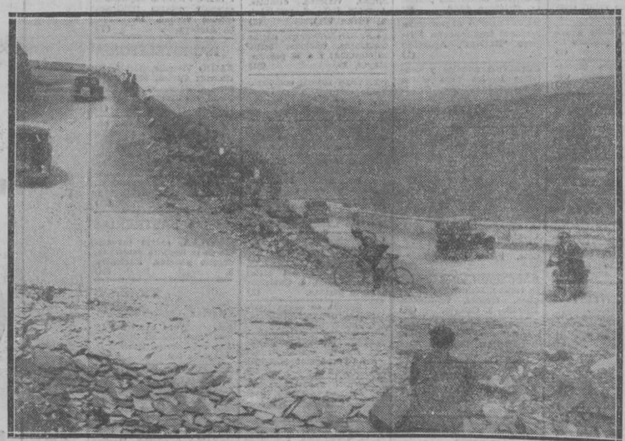
Arriba los corredores en un paraje próximo a la cuesta de Orduña; abajo, el corredor Montero, después de haber logrado sacar ventaja a los demás, llegando primero a dicha cuesta (Fot. Espiga).