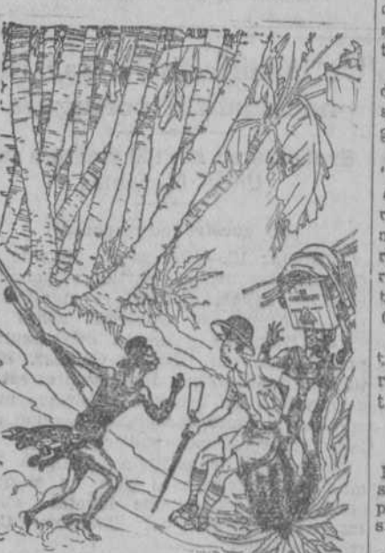
EL SALVAJE.—¡Huellas de león hacia el Norte, mi amo!

—No; pero si tuviera aquí mi cornetín tocaba esa música inmediatamente. ("Smith's Weekly", Sydney).