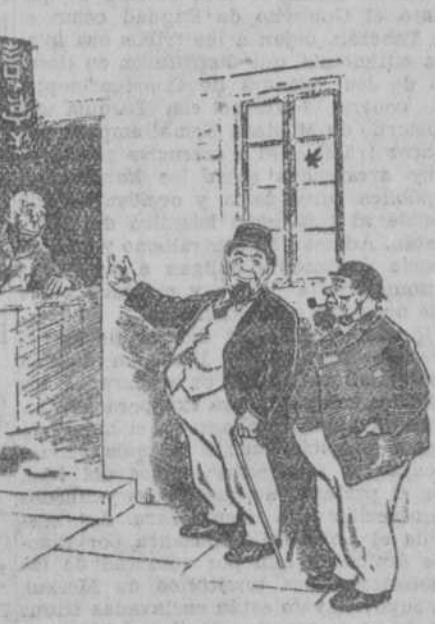
—A ver si eres capaz de leer ese rótulo.

—No te preocupes de eso. He pensado ya en dos sustitutos para tu plaza. ("Pages Gales", Iverdon).