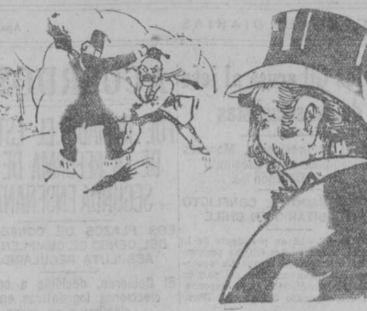
EL INGLÉS.—El que se ríe el último, es el que se ríe mejor. ("Malsh", El Cairo.)

tal relieve algunos de ellos, que el interés con que fueron acogidos justifican plenamente las cuatro horas y media que duró el Consejo.