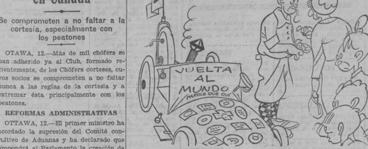
—"Dieg" séntimos la "pogstal". —Tenga; pero dé otra vueltecita, que yo acabo de llegar ahora.