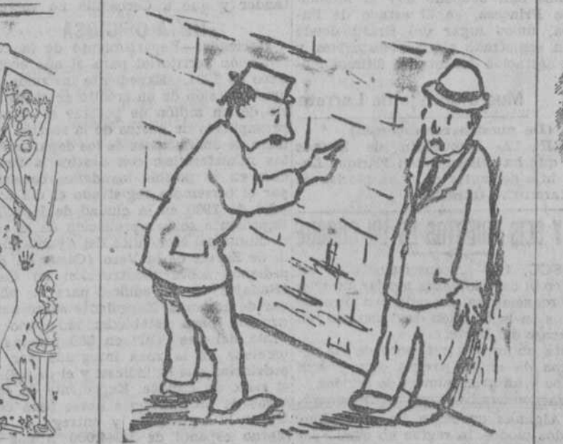
¡Pero si me encargo de esa labor me expondgo a caer del tejado al suelo y partirme la cabeza!

LA VISITA.—¡Este, hijo mío! ¡Pobrecito! En teniendo estampas que recortar ya está contento. ("Le Rire", París).