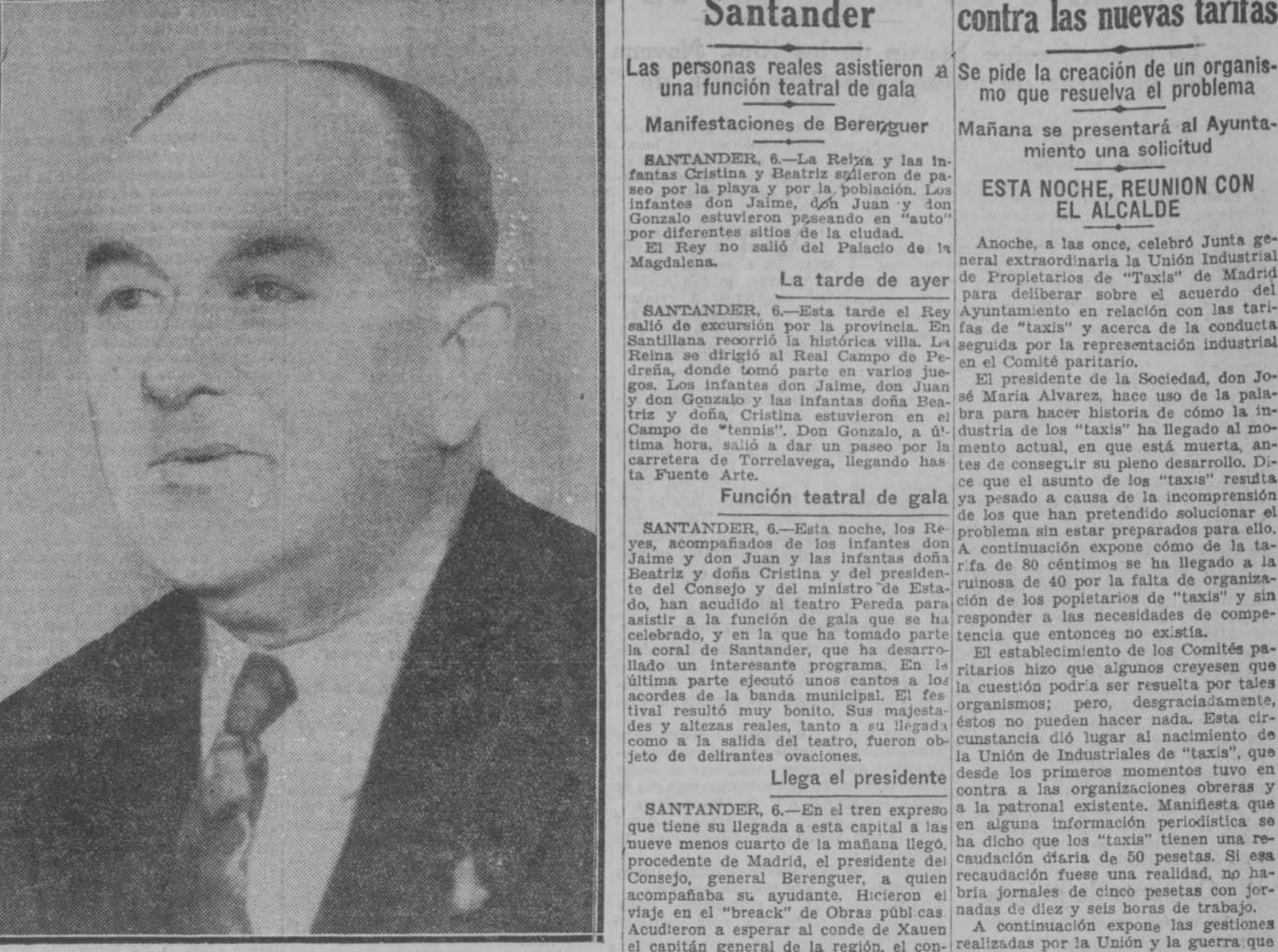
El coronel norteamericano William E. Easterwood, que ha instituido un premio de doscientas mil pesetas para el primer vuelo Madrid-Nueva York