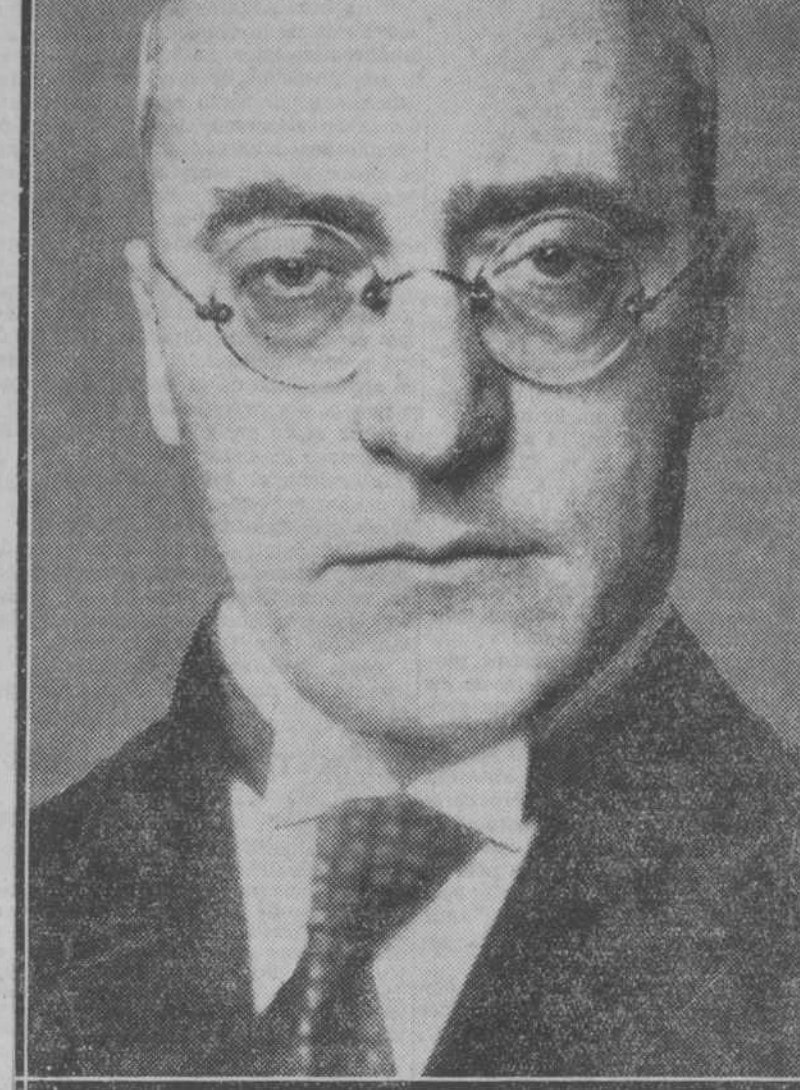
Heinrich Brüning, presidente del Gobierno alemán que ha apelado al artículo 48 de la Constitución para poder gobernar por decreto