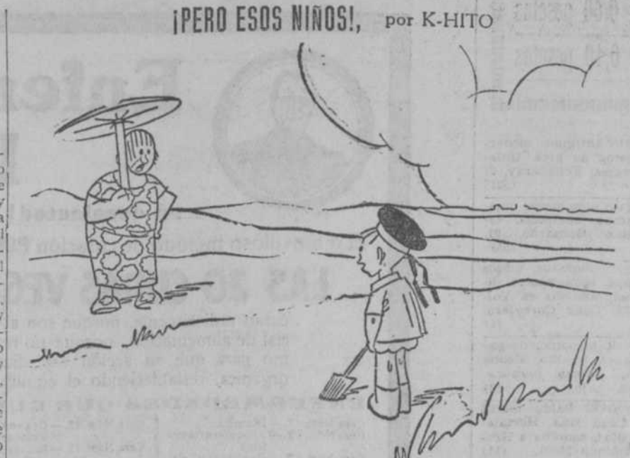
—¡Quitate de ahí, niño! ¡Quitate de ahí, que te va a pillar la prolongación de la Castellana!