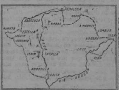
Zona potásica de Navarra