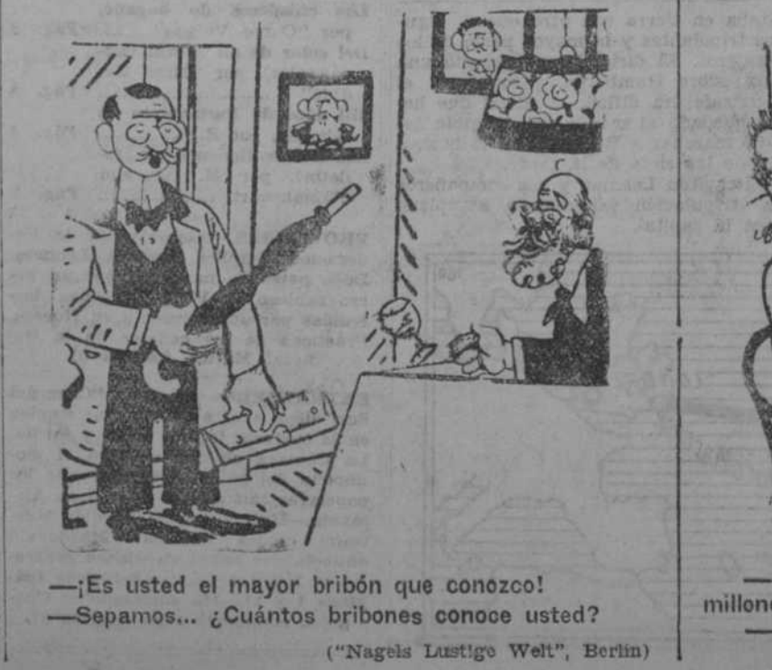
—¿Es usted el mayor bribón que conozco! —Sepamos... ¿Cuántos bribones conoce usted? ("Nagels Lustige Welt", Berlin)