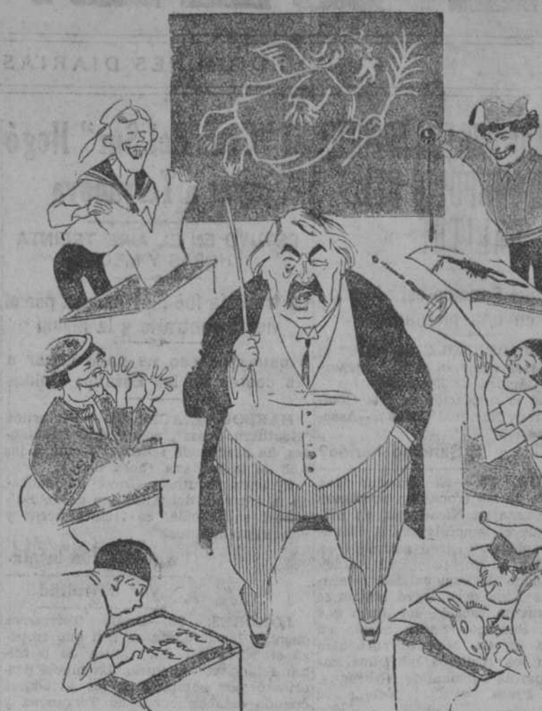
EL MAESTRO Y LOS DISCIPULOS ("Kladderadatsch", Berlin.)

(En el dibujo, el único alumno que trabaja es el primero de la izquierda, contando desde abajo, que representa al Michel alemán; es decir, que Alemania es la única, según el caricaturista, que atiende la sugestión francesa.)