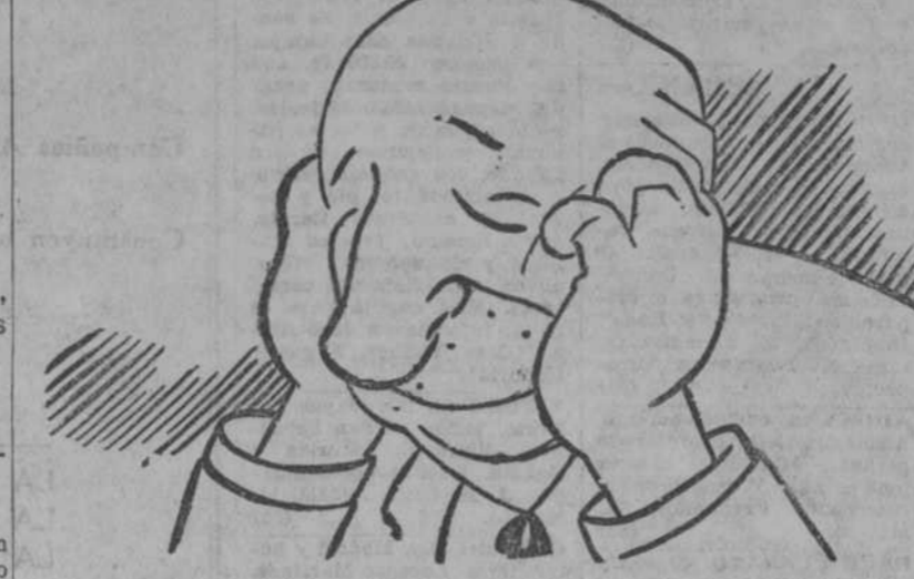
"Sevilla, Guadalquivir: ¡cuán atormentáis mi mente!"