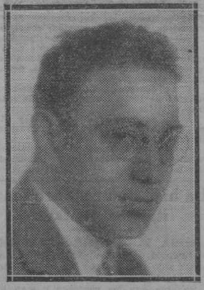
EL DOCTOR LORENTE DE NO

Al hacerse cargo del Instituto el señor Peña (Continúa al final de la primera columna de segunda plana)