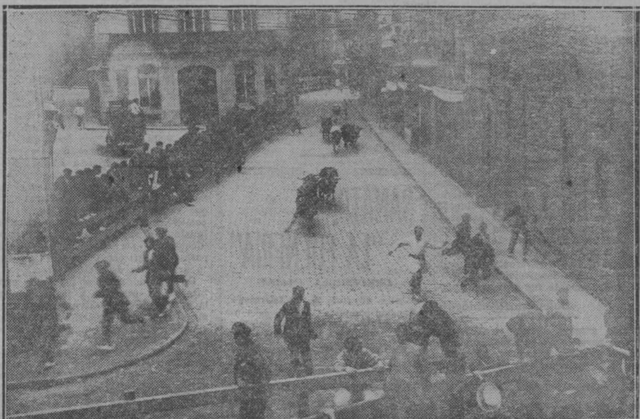
Varoniles, fuertes, valerosos, los pamploneses continúan la vieja tradición de pasear a los toros por las calles de la ciudad para conducirlos a la Plaza. Y con alegría y regocijo juegan con los cornúpetos, corriendo delante de ellos, como si las calles fueran un antipico del coso taurino.

comprende de pronto cómo desde la plaza del Castillo, por un pasadizo del teatro se salga a las afueras, aunque en estas afueras haya un magnífico y moderno barrio de ensanche; no se da una cuenta exacta de que la catedral se asoma a las murallas que limitan la población hacia levante, ni de que la longitud de la calle de la Estafeta sea más de la mitad del ancho de la población en dirección aproximada norte-sur.