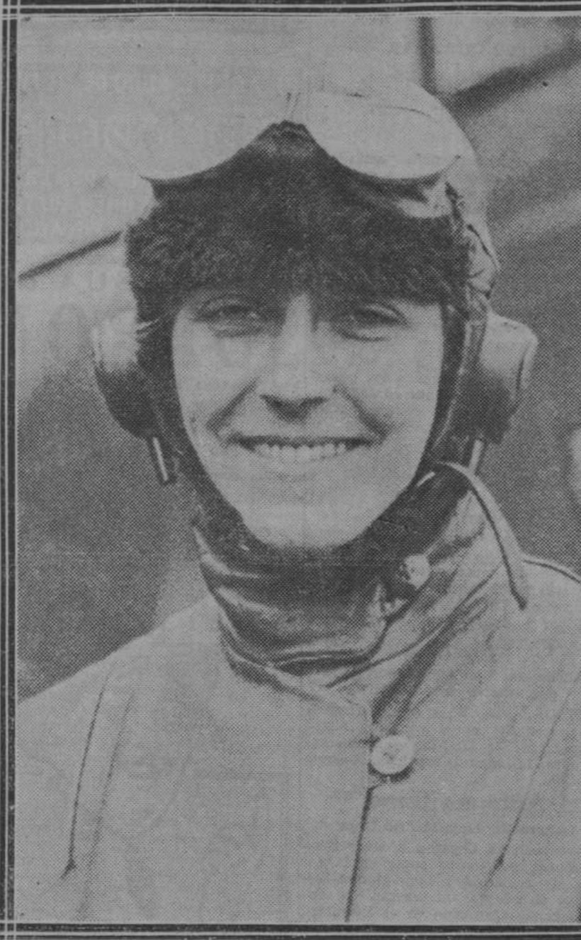
Miss Amy Johnson, aviadora inglesa que ha hecho el vuelo de Londres a Australia