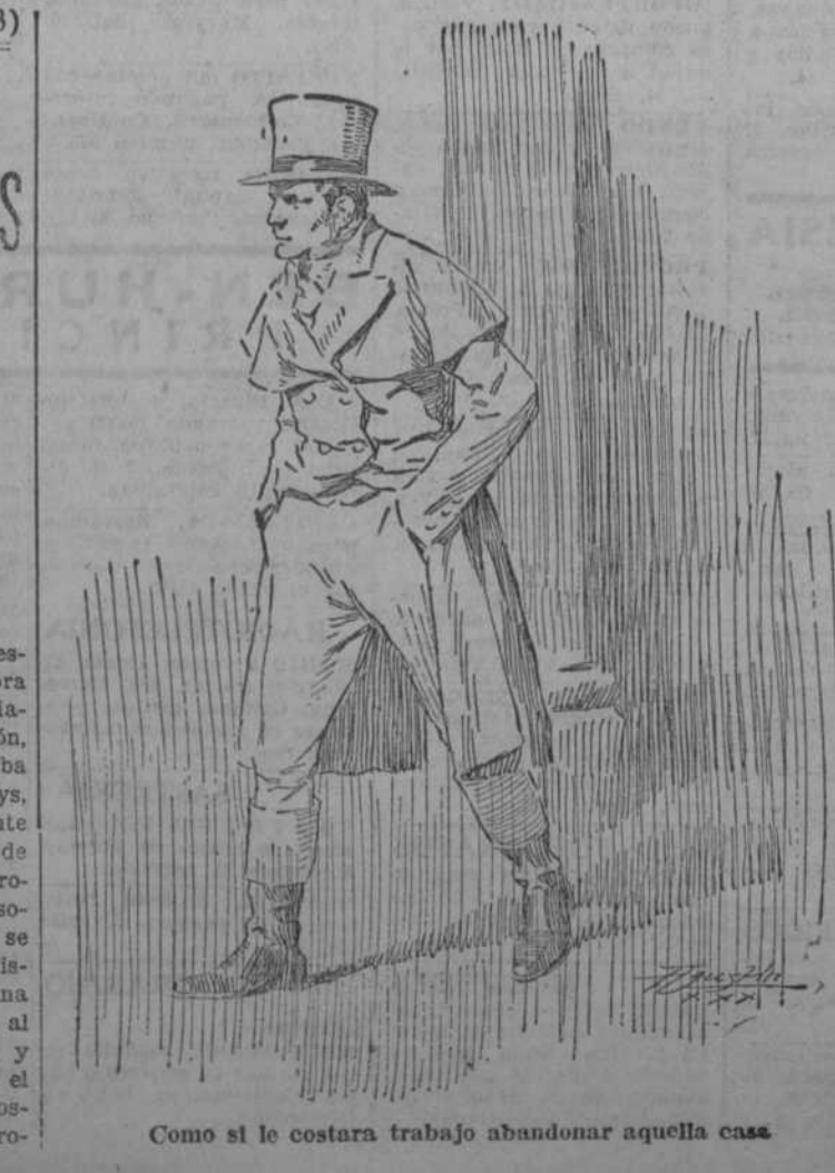
Como si le costara trabajo abandonar aquella casa

La inglesa, mujer práctica, ante todo para no desmentir las características de su raza, emprendedora y activa con infatigable actividad, mundana y sociable por temperamento no menos que por educación, a pesar de sus sesenta años cumplidos, que llevaba muy bien, no perdió su tiempo. El conde de Kerlys, uno de sus más íntimos amigos de la infancia, residente en la sazón en Nantes y a quien había escrito antes de salir de Londres anunciándole la fecha en que se propoía desembarcar en la ciudad francesa, acudió pronto con puntualidad británica, al hotel en que se hospedaba la dama, para saludarla y ponerse a su disposición. A ruegos de lady Kenbury, que sentía una gran predilección por el arte escénico, la acompañó al teatro, donde vieron transcurrir la tarde distraída y agradablemente, y donde con toda calma planearon el programa para el día siguiente, pues la viajera, mostrándole sus deseos de visitar detenidamente el Museo pro-