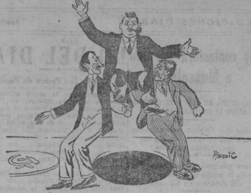
HERRIOT.—Nosotros somos el parti del centro. BLUM.—Sostengámonos algún tiempo o todavía; nos ha de traer prosélitos.