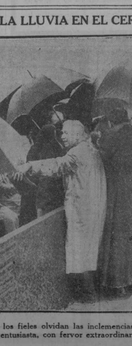
LA COMUNION BAJO LA LLUVIA EN EL CERRO DE LOS ANGELES

En las tristes jornadas de 1898, amenazada Manila por un bombardeo por la escuadra enemiga, se le invitó a retirarse del Observatorio, colocado en sitio muy descubierto.