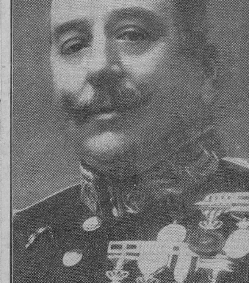
El general don Enrique Marzo Balaguer, que se afirma será nombrado ministro de la Gobernación