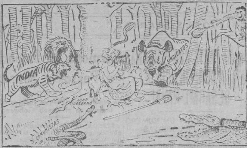
JOHN.—La música de usted debe ser maravillosa; pero ¿no cree que se están acercando demasiado? ("Daily Express", Londres.)

del Reich, de modo que en el porvenir podría ser destituido el presidente del Reichsbank por un decreto del presidente del Reich. De este modo se mantendría incólume la autonomía financiera y monetaria del Reichsbank, tal como hoy existe.