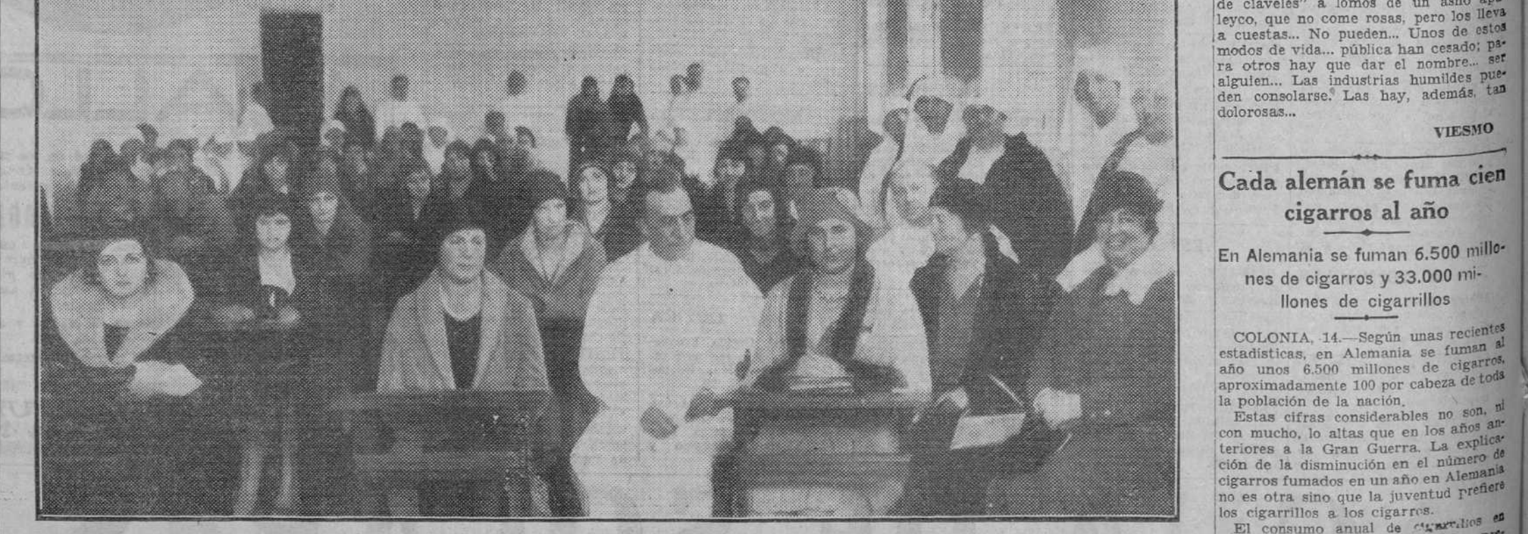
Sus altezas reales las infantas doña Beatriz y doña Cristina en el Hospital de la Cruz Roja. La fotografía superior muestra a la infanta Beatriz en su papel de enfermera entregada con la mayor atención a las prácticas. En la de abajo se ve a la infanta Cristina, que empuja este año sus lecciones, en la inauguración del curso. (Foto. Vidal).