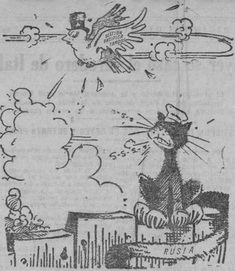
EL GATO RUSO Y LA PALOMA DE WASHINGTON