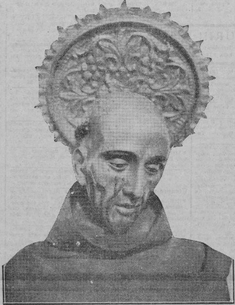
Una bella muestra de la imaginaria ecuatoriana: Cabeza de San Bernardino de Sena, por el padre Carlos

Nos referimos a la obra que, galardonada justamente por la Real Academia de Bellas Artes, viene en época oportuna de exposiciones y evocaciones sugerentes de hispanoamericanis-