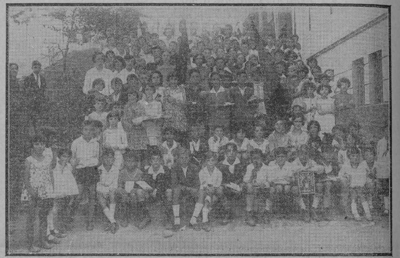
Los niños y niñas de las Escuelas Nacionales y el Asilo Municipal de La Coruña, que han sido premiados con libros, juguetes y libretas de la Caja de Ahorros con motivo de la apertura del nuevo curso.