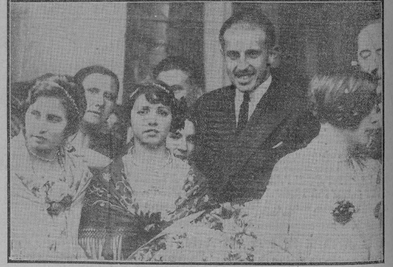
El infante don Jaime entre las obreras gijonesas, que le entregaron un ramo de flores