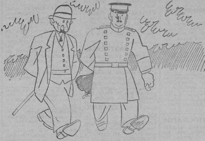
—Ha sido como tenía que ser: un homenaje popular y sincero.— Eso es; sin golpes de bombo y platillos.