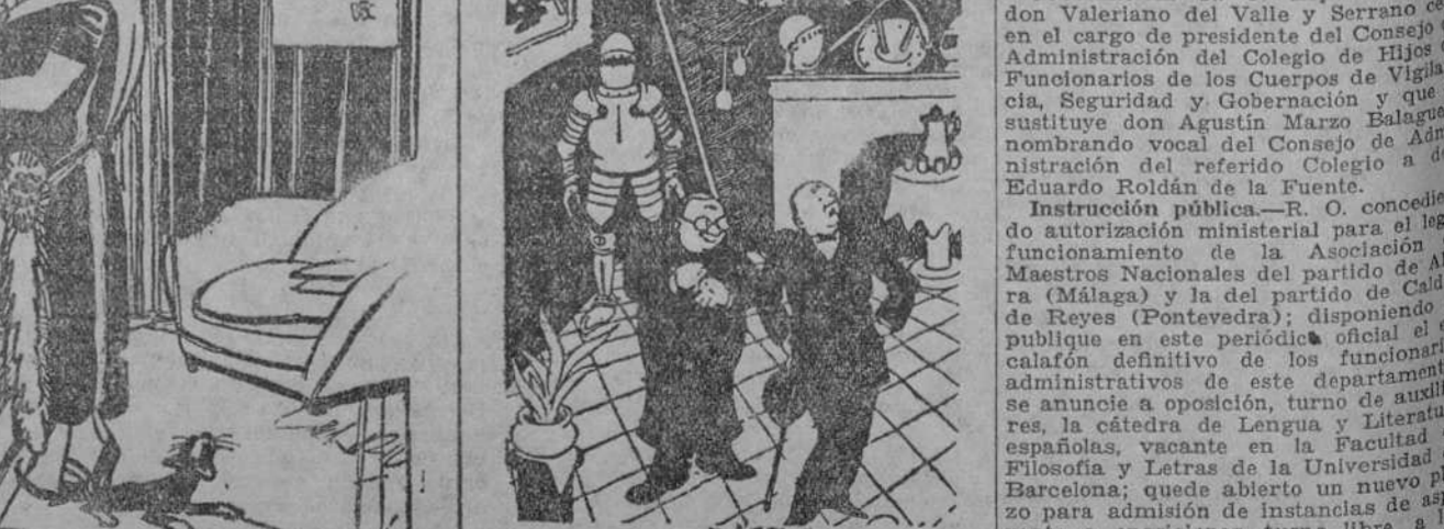
—Soy la bella mariposa, frágil fresca y primo...