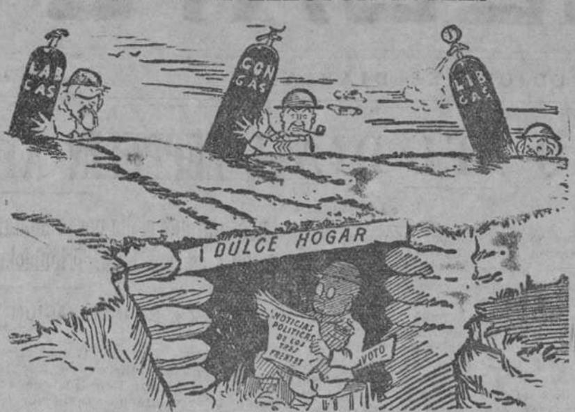
Empieza el ataque con gases asfixiantes. Así, no le salva la trinchera