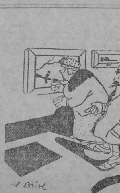
—Siempre te encuentro aquí.