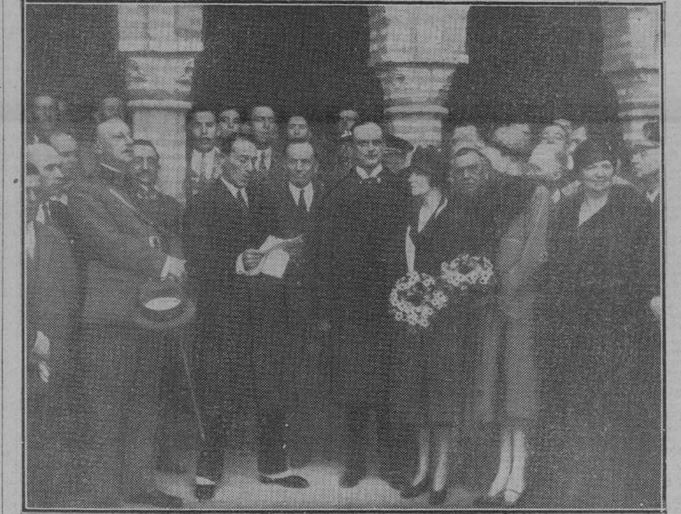
El duque de Alba leyendo un discurso durante la visita que hicieron al Monasterio de La Rábida el general Primo de Rivera y demás personalidades que asistieron a la inauguración del monumento a Colón en Huelva