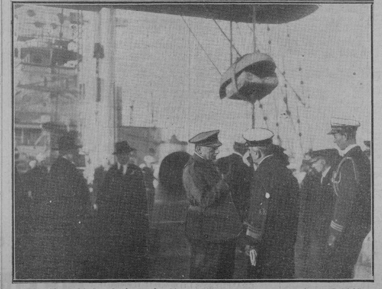
El presidente del Consejo durante la visita que hizo al crucero norteamericano "Raleigh", conversando con el comandante de dicho barco